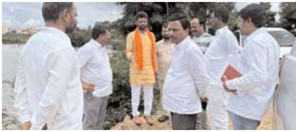
గణేష్ నిమజ్జన ఏర్పాట్లలో ఎలాంటి లోటుపాట్లు జరగరాదు : భాగ్యనగర్ గణేష్ ఉత్సవ సమితి