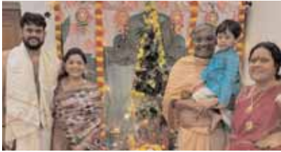
వాసవి యువజన సేవ సంఘం ఆధ్వర్యంలో కొలువైన గణనాథుడు