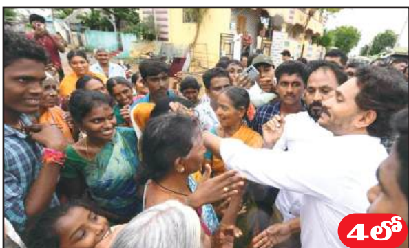
పెండ్లిమర్రి, మేజర్ న్యూస్: రాష్ట్ర మాజీ ముఖ్యమంత్రి వైయస్ జగన్మోహన్ రెడ్డి శనివారం పెండ్లి మరి మండలంలో సుడిగాలి పర్యటన చేశారు

పెండ్లి మరి మండలంలో మాజీ ముఖ్యమంత్రి వైయస్ జగన్మోహన్ రెడ్డి సుడిగాలి పర్యటన అడుగుడుగునా ప్రజల అభివృద్ధి పలికిన కార్యకర్తలు