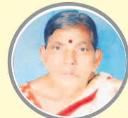
విద్యుత్పూతంతో మృతి చెందిన మహిళ