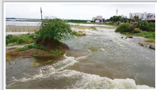
మత్తడి దూకుతున్న కొత్తపల్లి చెరువు....