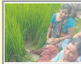
పిడుగుపాటుకు మృత్యుచెందిన రైతు