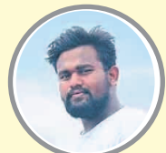
నక్కల వాగులో గల్లంతైన కారోబార్