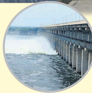
ఎల్లంపల్లి గేట్ల ద్వారా దిగువకు నీటి విడుదల