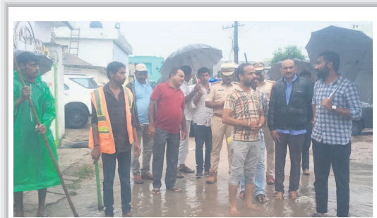
వరద ప్రాంతాలను పరీశీలిస్తున్న జగిత్యాల జిల్లా కలెక్టర్