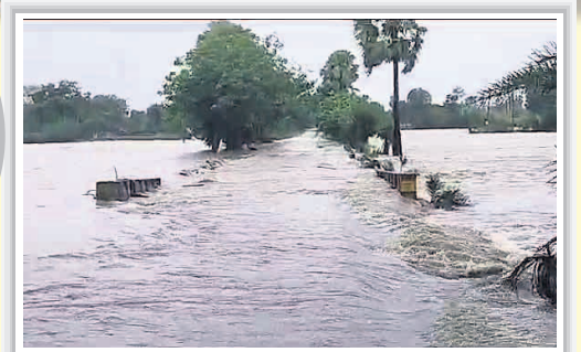
ఇల్లందకుంటలో రహదారిపై ప్రవహిస్తున్న వరద నీరు...