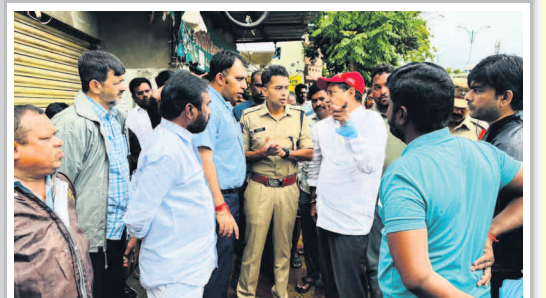
వరద ప్రాంతాలను పరీశీలిస్తున్న సిరిసిల్ల జిల్లా కలెక్టర్, ఎస్పి