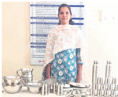
బదులు, స్టీల్ వస్తువులను కొనుగోలు చేయించు చున్నారు. అన్ని గ్రామ పంచాయతీలలో ఈ విధానం అమలు చేయాలని అధికారులు ఆదేశించడంతో, పంచాయతీ కార్యదర్శులు స్టీల్ వస్తువులను కొనుగోలు చేస్తున్నారు. ఇకనుండి ఏ