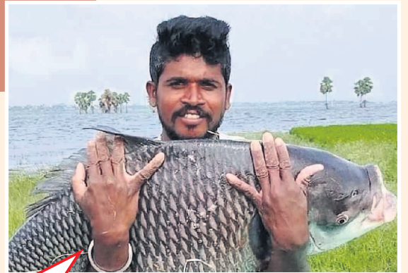
కరీంనగర్ ఎల్ఎండి మానేరు డ్యామ్ తిమ్మాపూర్లో జాలరి వలకు చిక్కిన 28 కిలోల బొచ్చే చేప