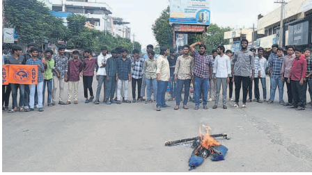
విద్యార్థి విభాగం ఆధ్వర్యంలో సిరిసిల్లా నేతన్న చౌరస్తా వద్ద సీఎం రేవంత్ రెడ్డి దిష్టిబొమ్మను

సూర్య సిరిసిల్లా టౌన్ రాజన్న సిరిసిల్లా జిల్లాలోని గురుకుల పాఠశాలలో నెలకొన్న సమస్యలను పరిష్కరించడంలో ప్రభుత్వం విఫలమైందని ఏబీవీపీ ఆధ్వర్యంలో సీఎం రేవంత్ రెడ్డి దిష్టిబొమ్మను దహనం చేశారు. రాజన్న సిరిసిల్లా జిల్లాలో ఉన్న ప్రభుత్వ గురుకుల పాఠశాలలో నెలకొన్న సమస్యలను పరిష్కరించడంలో రాష్ట్ర ప్రభుత్వం విఫలమైందని, స్థానిక ప్రభుత్వ విప్లు ఏమాత్రం వట్టింతుకోవడంలేదని ఆగ్రహం వ్యక్తం చేస్తూ భారతీయ జనతా పార్టీ