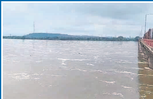
గోదావరి నది వద్ద వరద ఉధృతి

రెండు రోజులుగా ఎడతెరపి లేకుండా కురుస్తున్న భారీ వర్షాలకు ఎగువ నుండి పెద్దపల్లి జిల్లా అంతర్గం మండలంలోని శ్రీ పాద ఎల్లంపల్లి ప్రాజెక్టుకు భారీగా వరద నీరు వచ్చి చేరుతుంది. ఎగువున ఉన్న కడెం ప్రాజెక్టు ఇతర వాగుల నుండి వరద నీరు ఎల్లంపల్లి ప్రాజెక్టుకు చేరుకోగా సోమవారం అధికారులు 30 గేట్లను ఎత్తి దిగువకు నీటిని విడుదల చేశారు. ఎల్లంపల్లి ప్రాజెక్టులో (మిగతా 2లో)