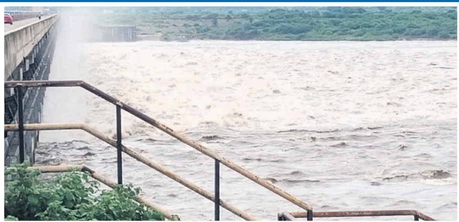
ఎల్లంపల్లి ప్రాజెక్టు వద్ద గేట్లు ఎత్తడంతో దిగువకు పోవెత్తిన వరద నీరు