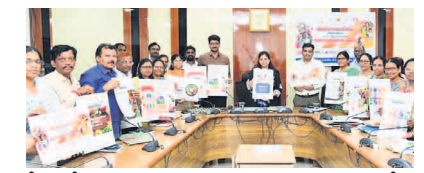
తీసుకోవలసిన పోషకాహారం గురించి వివరించే ప్రదర్శనలు, సమావేశాలు, ర్యాలీలు, మేళా వంటివి ఏర్పాటు చేయాలన్నారు. ఆశ, ఏఎన్ఎం, అంగన్వాడీ టీచర్లు గ్రామైక్య సంఘాల సభ్యులు, పంచాయతీ కార్యదర్శులు పోషణ మహాలో పాలుపంచుకోవాలని అన్నారు. అన్నప్రాసన, సీమంతం, వంటల పోటీలు, ఆటలు, కథ నాటకం, బేబీ షో వంటి కార్యక్రమాల ద్వారా పోషకాహారం పట్ల ప్రజలకు అవగాహన కల్పించాలని కోరారు. జిల్లాలో