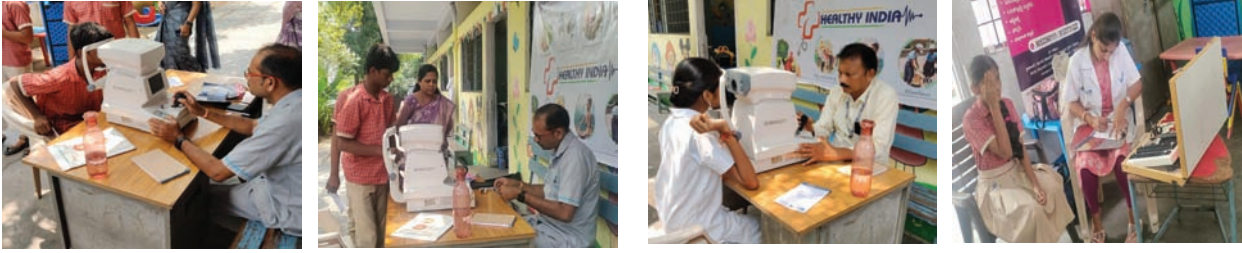
సూర్య మేజర్ న్యూస్

విద్యార్థుల ఆరోగ్యం మరియు శ్రేయస్సును పెంపొందించడానికి శ్రీ చైతన్య స్కూల్, మామిళ్లగూడెం బ్రాంచ్ లో విద్యార్థుల కోసం “ఐ కాం ప్స్” విజయవంతంగా నిర్వహించారు. ఈ కార్యక్రమం “స్టార్ట్ లివింగ్ ప్రోగ్రామ్ - హెల్త్ ఇండియా అనే విస్తృత అంశంలో భాగంగా నిర్వహించబడింది. ఇది విద్యార్థుల్లో ఆరోగ్యకరమైన జీవనశైలిని ప్రోత్సహించడం మరియు నివారణ ఆరోగ్య సంరక్షణపై అవగాహన కల్పించడం