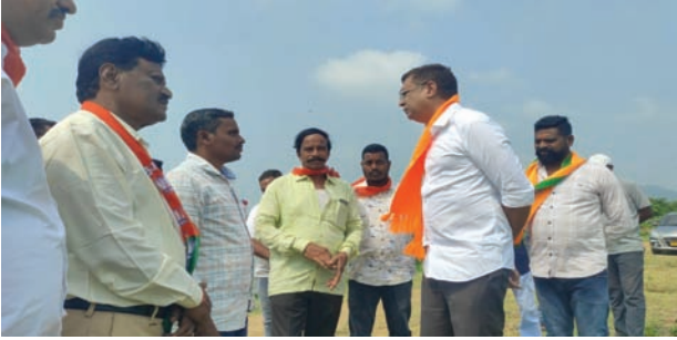
సుజాతనగర్, సెప్టెంబర్ 21:సూర్య (మేజర్ స్యూస్):