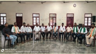
ఖమ్మం సూర్య (మేజర్ స్యూస్):

-అఖిలపక్ష కార్మిక రైతు సంఘాల నాయకుల పిలుపు