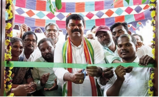
కాంగ్రెస్ ప్రభుత్వం ప్రతి ఒక్కరికి అండగా ఉంటుంది మహిళలను గృహ జ్యోతి గురించి అడిగి తెలుసుకున్న ఎమ్మెల్యే ప్రతి నియోజకవర్గానికి 3500 వందల ఇందిరమ్మ ఇల్లులు