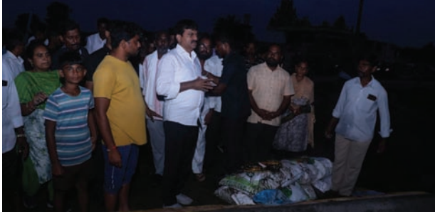
ఖమ్మం, సూర్య బ్యారో సెప్టెంబర్ 3:

వరద సహాయక చర్యల్లో వేగం పెంచి, బాధితులకు తోడ్పాటు నివ్వాలని రాష్ట్ర రెవెన్యూ, హౌజింగ్, సమాచార పౌరసంబంధాల శాఖల మంత్రి పొంగులేటి శ్రీనివాసరెడ్డి అన్నారు. మంత్రి మంగళవారం ఖమ్మం రూరల్ మండలం వాల్యా తాండ, కన్న తాండ, తనకంపాడు గ్రామాల్లో పర్యటించి వరద బాధితులను అధైర్య పడొద్దని, ధైర్యంగా ఉండాలని ఓదార్చారు. మంత్రి ఇంటింటికి తిరిగి వరద నష్టాన్ని పరిశీలించారు. ఇండ్లు, వస్తువులు, షాపులు, పంట పొలాలు నష్టపోయిన ప్రతి ఒక్క బాధితులకు ప్రభుత్వం అండగా ఉంటుందని మంత్రి భరోసా ఇచ్చారు. ఆకేరు వాగు ను పరిశీలించి, దెబ్బతిన్న బ్రిడ్జి పునరుద్ధరణకు వెంటనే చర్యలు చేపట్టాలని అధికారులను ఆదేశించారు. కన్నతండాలో ఫర్లైజర్ షాపు సరుకుతో సహా వరదలో కొట్టుకు పోవడం జరిగిందని తెలుపగా, మంత్రి పరిశీలించారు. బాధితులను ప్రభుత్వ పరంగా ఆదుకుంటా మన్నారు. రెవెన్యూ అధికారులు ఇంటింటికి వెళ్లి, క్షేత్ర స్థాయిలో నష్ట అంచనాలు చేయాలన్నారు. వ్యవసాయ అధికారులు పంట నష్టం అంచనాలు చేపట్టాలన్నారు. త్రాగునీటి సరఫరాకు చర్యలు తీసుకోవాలని అన్నారు. విద్యుత్ అధికారులు విద్యుత్ స్తంభాలు,