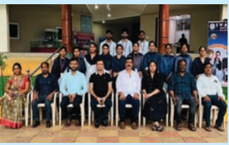
ఖమ్మం, సూర్య (మేజర్ స్యూస్):