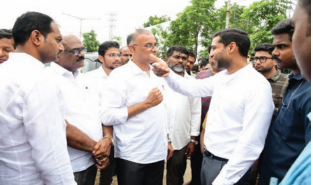
ఖమ్మం రూరల్, సూర్య మేజర్ న్యూస్