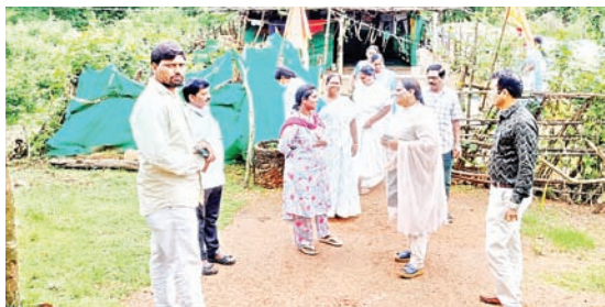
పెంట్లంలో ఎన్సీడీ క్యాంప్..