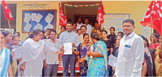
లేబర్కోడ్లు రద్దు చేయాలని తహశీల్దార్ కు వినతి