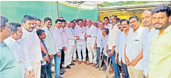
నూతన ప్రాజెక్టులకు సూరవరం ప్రతాపరెడ్డి పేరు పెట్టాలి