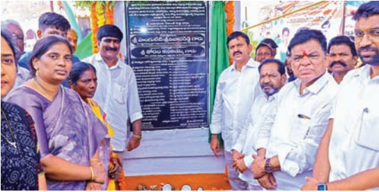
పలు అభివృద్ధి పనులకు శంకుస్థాపనలు ప్రారంభోత్సవాలు