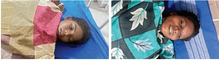
ఇద్దరు పరిస్థితి విషమం..