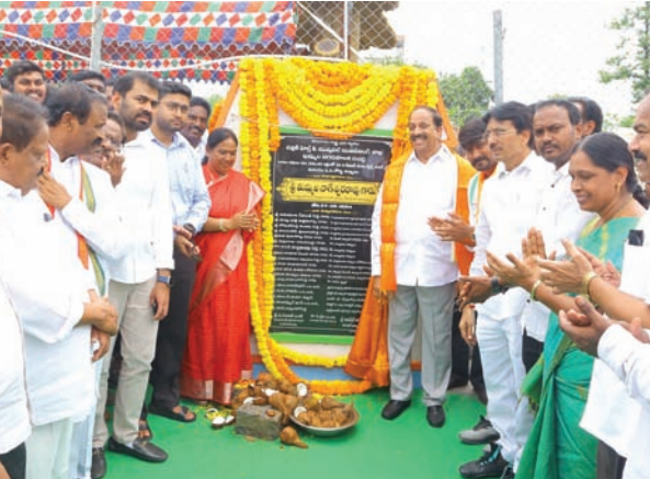
ఖమ్మం