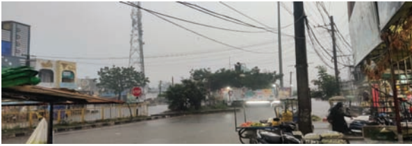
పెనుబల్లి సూర్య మేజర్ న్యూస్....

- సంతోషం వ్యక్తం చేస్తున్న రైతులు - డబ్బులు వర్షంగా అభివర్ణం