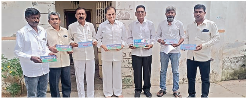
ఐదు గ్రామపంచాయతీలను తెలంగాణలో కలపాల్పిందే

ప్రభుత్వ భూముల పరిరక్షణకై భద్రాచలంలో కూడా హైద్రాబాద్ అమలు చేయాలి