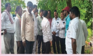
కామేపల్లి సూర్య మేజర్ న్యూస్

కామేపల్లి మండల జర్నలిస్టులు మంగళవారం స్థానిక ఎమ్మెల్యే కోరం కనకయ్యను మర్యాదపూర్వకంగా కలిశారు. ఈ సందర్భంగా పలు సమస్యలను ఎమ్మెల్యే దృష్టికి జర్నలిస్టులు తీసుకువచ్చారు. స్పందించిన ఎమ్మెల్యే అర్హతైన జర్నలిస్టులకు ఇళ్ల స్థలాలతోపాటు, ప్రభుత్వం నుంచి వచ్చే ప్రతి ఒక్క పథకాన్ని వర్తింపజేస్తామని హామీ ఇచ్చారు.