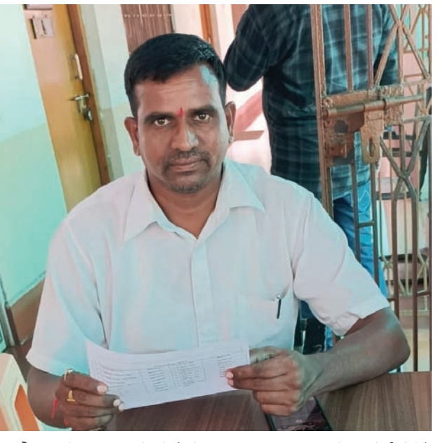
ఉపాధ్యాయులుగా నియామక ప్రతాలు అందించాలన్నారు. ఇప్పటివరకు జరిగిన అన్యాయాన్ని, నష్టాన్ని గుర్తించి న్యాయం చేయాలని రాష్ట్ర ప్రభుత్వాన్ని విజ్ఞప్తి చేశారు.