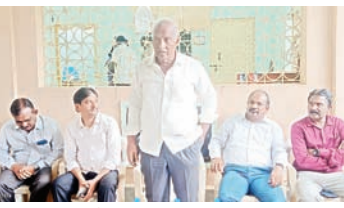
ప్రభుత్వ వేతన జీవో 22 అమలుకు ప్రభుత్వంపై వత్తిడి తెస్తున్నాం ప్రభుత్వ సంక్షేమ పథకాల్లో కాంట్రాక్టు కార్మికులకు ప్రాధాన్యత కల్పిస్తాం