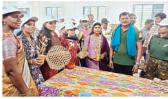
ఈ విహారయాత్ర తమను ఎంతో ఆనందాన్ని కలిగించింది