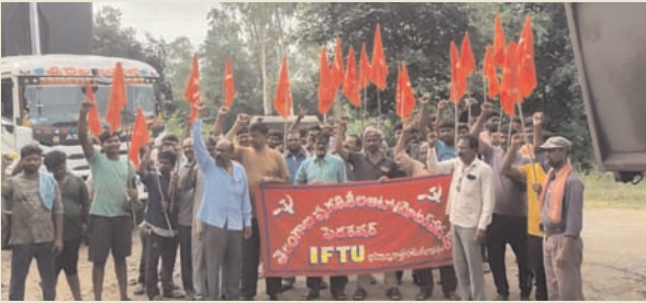
ఇల్లందుటౌన్, సూర్య (మేజర్ న్యూస్).