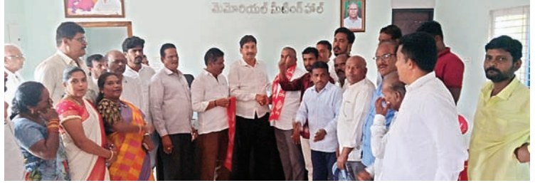
భార్యతాయుతంగా ప్రజలకు సేవలందించాలి

కూననేని సహకారంతో రామాంజనేయ కాలనీ జిపిఐ లభ్యవృద్ధి చేసుకుందాం