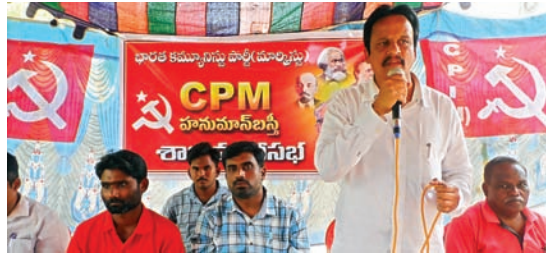
కమ్యూనిజం దేశానికి ప్రత్యామ్నాయం