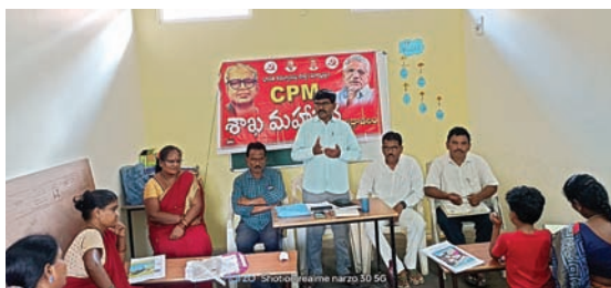
స్లాయిస్ ల వెంటనే మరమ్మత్తులు చేయాలి..

ప్రజలు ఇబ్బందులు పడకుండా శాశ్వత పరిష్కారం చూపాలి..