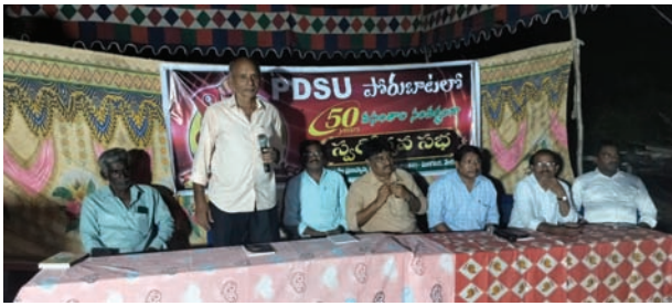
నేలకొండపల్లి సూర్య మేజర్ న్యూస్