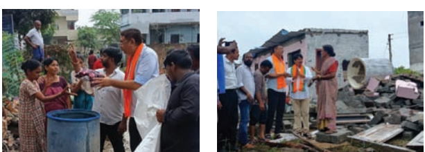
ఖమ్మం, సూర్య (మేజర్ స్టూన్):

-మానవసేవయే మాధవ సేవగా భావించి నేనున్నానంటూ బాధితులకు భరోసా -వరద ముంపు ప్రాంతాల్లో భోజనాలు దుప్పట్లు పంపిణీ