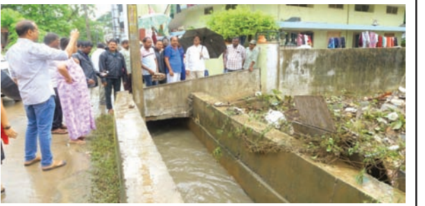
సూర్య ప్రతినీధి ఖమ్మం సెప్టెంబర్ 4

వర్షంలో సై తం పర్యటిం చిన మంత్రి తుమ్మల నాగేశ్వరరావు బుధవారం కాల్వ ఒడ్డు సారధి నగర్లో వర్షంలో విస్తృతంగా పర్యటిస్తు వారి బాధలు తెలుసు కుంటూ సంబంధిత అధికారులకు తగు సూచనలు చేస్తూ సత్వరమే అట్టి పని అయ్యే విధముగా చూడాలని ఆదేశాలు జారీ చేస్తూ వరద బాధితులకు నిత్య వస్తువులు పంపిణీ చేశారు ఖమ్మం మున్సిపల్ కార్పొరేషన్ కార్యాలయంలో వరద బాధితుల కోసం ప్రభుత్వ సహాయ కిట్లు నిత్యావసర వస్తువులు, దుప్పట్లు, ఔట్ ఫీట్, ప్యాకింగ్ ల ను వ్యవసాయ శాఖ మంత్రి తుమ్మల నాగేశ్వరరావు.. పరిశీలించారు.