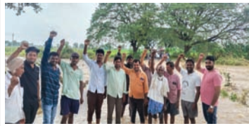
కామేపల్లి సూర్య మేజర్ స్టాఫ్

కామేపల్లి మండలం బండిపాడు స్టేజి వద్ద బుగ్గ వాగుపై హై లెవెల్ వంటెన ప్రభుత్వం నిర్మించాలని యువకులు డిమాండ్ చేస్తున్నారు. ఖమ్మం మహబూబాబాద్ రెండు జిల్లాలను కలిపే ఈ మార్గం వర్షాకాలంలో చిన్న తేలికపాటి వర్షానికి కూడా నీరు బ్రిడ్జి పైనుంచి ప్రవహిస్తుండడంతో రాకపోకలకు తీవ్ర అంతరాయం ఏర్పడుతున్నది ఎన్నిసార్లు ప్రభుత్వానికి విన్నవించుకున్నా ఈ బ్రిడ్జిని పట్టించుకున్న పాపాన పోలేదు. ఇప్పటికైనా అధికారులు ప్రజాప్రతినిధులు స్పందించి బుగ్గ వాగు పై హై లెవెల్ వంటెన నిర్మించాలని ప్రజలు కోరుకుంటున్నారు.