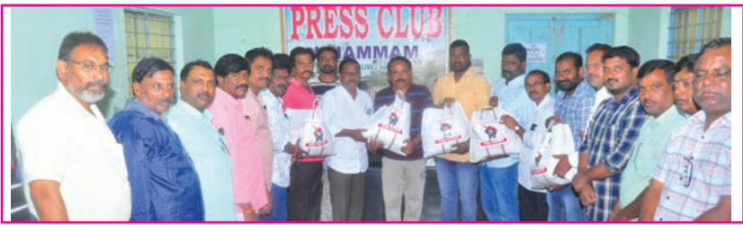
ఖమ్మం, సూర్య (మేజర్ న్యూస్):