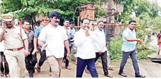
బుధవారం రాత్రి కురిసిన భారీ వర్షానికి జలమలయమైన ఇల్లండు పట్టణం