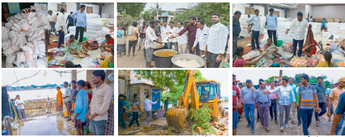
పంపిణీ సిద్ధమవుతున్న నిత్యావసరాలు, వస్త్రాలు శుక్రవారం నుంచి బాధితులకు అందజేత ఇప్పటికే గత నాలుగు రోజులుగా ట్రస్ట్ తరుపున ఆహారపానీయాల పంపిణీ