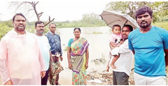
దేవస్థానం నిర్మించిన చెరువు కట్ట తెగే ప్రమాదం.. చెరువు కట్ట తెగకుండా ప్రత్యామ్నాయ ఏర్పాట్లు చేయాలి ఉన్నత అధికారులు జోకొం చేసుకొని తక్షణమే సమస్య పరిష్కరించాలి సిపిఎం భద్రాచలం పట్టణ కమిటీ డిమాండ్..

భద్రాచలం సూర్య (మేజర్ న్యూస్)- గత మూడు రోజులుగా కురుస్తున్న భారీ వానలు భద్రాచలం పట్టణం, జగదీష్ కాలనీ శివారులో దేవస్థానం శాఖ వారు నిర్మించిన చెరువు కట్ట తెగే ప్రమాదం ఉందని, చెరువు కట్ట మట్టి జారిన ప్రాంతంలో ఇసుక