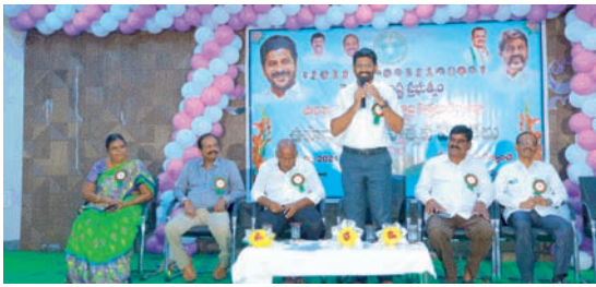
గురువులకు సమాజంలో ప్రత్యేక స్థానం ఉన్నది జిల్లా కలెక్టర్ జితేష్ వి పాటిల్, ఎమ్మెల్యే కూననేని ఘనంగా గురుపూజోత్సవ వేడుకలు