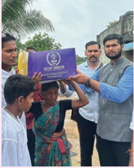
తిరుమలాయపాలెం, సూర్య మేజర్