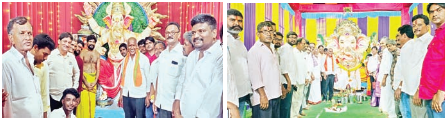
సంస్కృతి, సాంప్రదాయాలను కాపాడుకోవాలి