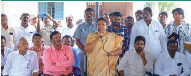
సత్తుపల్లి సూర్య మేజర్ న్యూస్