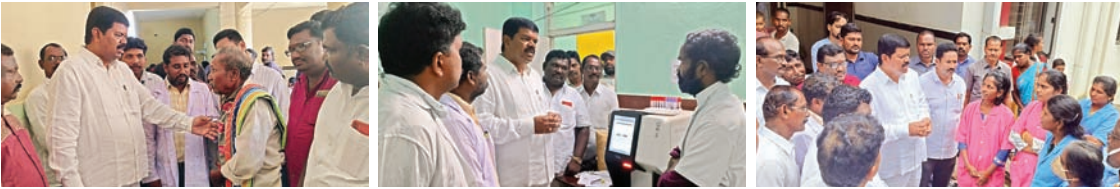
సీజనల్ వ్యాధుల పట్ల సిబ్బంది అప్రమత్తంగా ఉండాలి