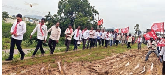
గతపాలకుల నిర్లక్ష్యం వల్లే ప్రమాదకర స్థాయికి చేరిన చెరువుకట్ట

నీటిపారుదల శాఖ అధికారులు సత్వర చర్యలు చేపట్టాలి