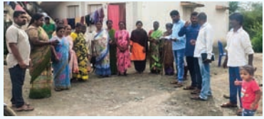
సింగరేణి సూర్య మేజర్ స్టూస్ సింగరేణి(కారేపల్లి సెప్టెంబర్ 10) మండలంలోని వరద ముంపుకు