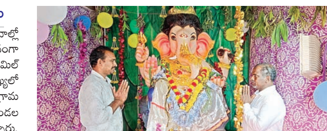
చేసి పూజలు నిర్వహించారు. వివిధ రూపాల్లో కొలువు దీరిన