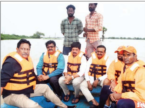
నిత్యం ప్రజలను అప్రమత్తం చేస్తూ సురక్షిత ప్రాంతాలకు తరలించేందుకు ప్రత్యేక చర్యలు