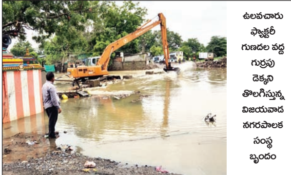
ఉలవచారు ఫ్యాక్టరీ గుండల వద్ద గుర్రపు దెక్కని తొలగిస్తున్న విజయవాడ నగరపాలక సంస్థ బృందం