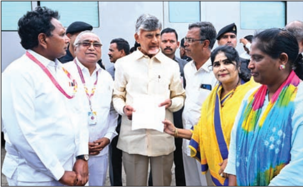
వరద బాధితులను ఆదుకునేందుకు ప్రజల నుంచి అనూహ్య స్పందన వరద బాధితుల కోసం తోచిన సాయంతో ముందుకు రావాలన్న సీఎం పిలుపును భారీ స్పందన సీఎం చంద్రబాబును కలిసి పెద్ద ఎత్తున విరాళాలు అందించిన పలువురు దాతలు

విజయవాడ బ్యూరో, మేజర్ స్టూన్ : వరద బాధితులను ఆదుకునేందుకు ప్రజల నుంచి అనూహ్య స్పందన లభిస్తోంది. ముఖ్యమంత్రి సహాయ నిధికి విరాళాలు వెల్లువలా వస్తున్నాయి. ప్రపంచవ్యాప్తంగా వివిధ రంగాల్లో స్థిరపడిన తెలుగువారు బాధితులను ఆదుకునేందుకు తమ వంతు చేయూతనిస్తున్నారు. వరద బాధితులను అందే సహాయ చర్యలను నిత్యం పర్యవేక్షిస్తూ 9 రోజులుగా విజయవాడ కలెక్టరేట్ లోనే ఉంటున్న ముఖ్యమంత్రి చంద్రబాబు నాయుడును కలిసి పలువురు విరాళాల చెక్కులను అందజేశారు. దాతలకు సీఎం అభినందనలు తెలిపారు. చరిత్రలో కనీవినీ ఎరుగని రీతిలో వచ్చిన వరదలతో తీవ్రంగా నష్టపోయిన బాధితులను తిరిగి సాధారణ స్థితికి చేర్చేందుకు తమ వంతు సహకారం అందిస్తున్న వారికి సీఎం కృతజ్ఞతలు తెలిపారు.