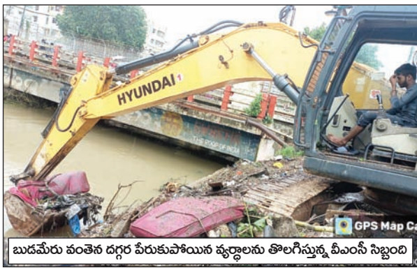
బుడమేరు వంతెన దగ్గర పేరుకుపోయిన వ్యర్థాలను తొలగిస్తున్న బీఎంసీ సిబ్బంది