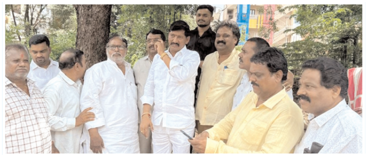
స్థలాన్ని పరిశీలిస్తున్న ఎంపీ బస్తిపాటి నాగరాజు