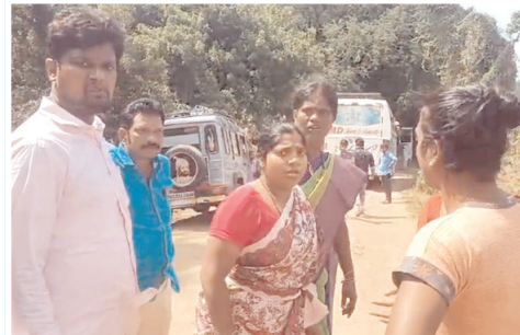
హిజ్రాతో వాగ్వివాదం చేస్తున్న మహిళ

మహానంది, మేజర్ న్యూస్ : మహానంది సమీపంలోని పాలేరు వాగు వద్ద హిజ్రాల ఆగడాలు మహానంది క్షేత్రానికి వచ్చే భక్తులు ఇబ్బందులు ఎదుర్కొంటున్నారు. సోమవారం సుదూరు ప్రాంతాల నుంచి వచ్చిన భక్తులు దర్శనం అనంతరం తిరిగి వెళ్తుండగా టూరిస్టు బస్సును అడగించి రూ.