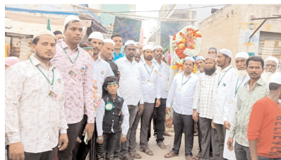
జెండాను ఊరేగింపుగా తీసుకెళ్తున్న దృశ్యం

కోసిగి మేజర్ న్యూస్: కోసిగి మండలంలో మిలాత్ ఈద్ వేడుకలను ముస్లింలు ఘనంగా జరుపుకున్నారు. కోసిగి, సాతనూరు, అర్లబండ, కందుకూరు గ్రామాలతో ఈ వేడుకలను మరికొన్ని గ్రామాలలో ఈ వేడుకలను జరుపుకోవడం జరిగింది. ఉదయం నుండి మధ్యాహ్నం వరకు కోసిగి, సాతనూరు గ్రామాలలో అన్నదాన