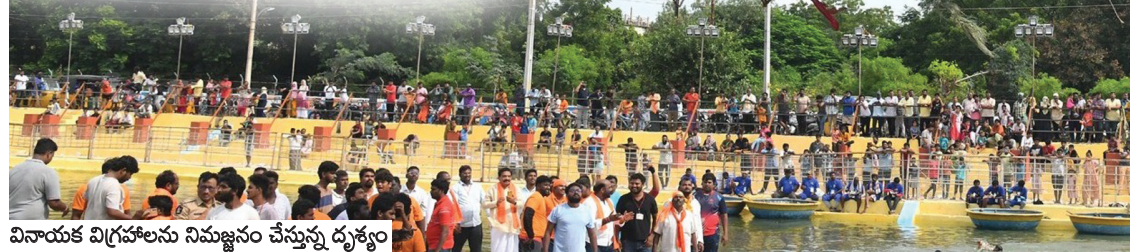
వినియోగ విగ్రహాలను నిమజ్జనం చేస్తున్న దృశ్యం

కర్నూలు, మేజర్ న్యూస్ ప్రతినిధి: కర్నూలు నగరంలో గణేశ్ నిమజ్జన కార్యక్రమం 2వరోజు సోమవారం కొనసాగింది. ఆదివారం ఉదయం ప్రారంభమైన నిమజ్జన కార్యక్రమం తెల్లవారు కొనసాగి సోమవారం ఉదయం 12గంటల వరకు సాగింది. నగరంలో కొలువైతిరిన సుమారు 2వేలకుపైగా గణనాథుడి విగ్రహాలను భక్తులంతటా భక్తి శ్రద్ధలతో శోభాయాత్రగా నిమజ్జనానికి తరలించారు. మిగతా 2లో