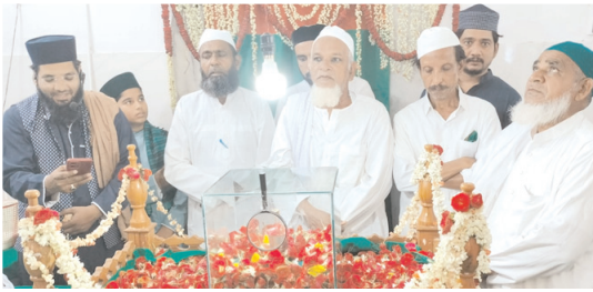
ఆసర్ మసీద్లో మహ్మద్ ప్రవక్త జన్మదిన వేడుకలు నిర్వహిస్తున్న మత పెద్దలు