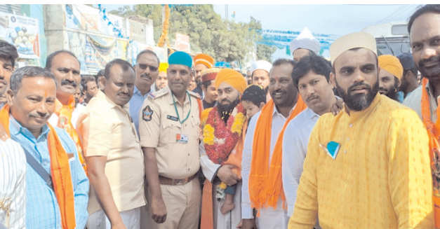
ర్యాల్లీలో పాల్గొన్న ముస్లిం మత పెద్దలు

బనగానపల్లె, మేజర్ న్యూస్ : మహ్మద్ ప్రవక్త జన్మదినంగా భావించే మిలాద్ ఉన్ - నబీ వేడుకలను బనగానపల్లెలో ఘనంగా నిర్వహించారు. అల్లాహ్ తరువాత ముస్లింలు అత్యధికంగా గౌరవించేది మహ్మద్ ప్రవక్తనే అందుకే ఇస్లాంలో ఆయనకు అంత గౌరవం ప్రవక్త అనుసరించిన జీవనశైలిని ముస్లింలు ఆచరిస్తుంటారని