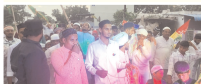
ర్యాల్లీ నిర్వహిస్తున్న ముస్లిం సోదరులు

ఆస్పరి, మేజర్ న్యూస్ : మహ్మద్ ప్రవక్త జన్మదినాన్ని ప్రత్యేక పండుగగా ముస్లింలు జరపడం ఆనవాయితీగా వస్తుంది. దయా ప్రేమ జాలి కరుణాయముడు దాన ధర్మాలకు ప్రతి రూపమే మహ్మద్ ప్రవక్త అని కొనియాడారు.