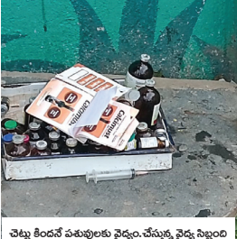
చెట్ల కింద పశువులకు వైద్యం చేస్తున్న వైద్య సిబ్బంది