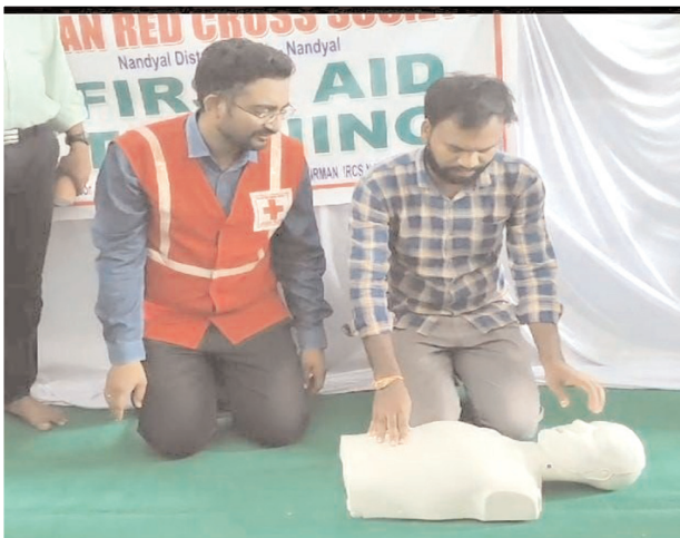
ప్రాణాపాయ స్థితిలో ఉన్న వారికి ప్రథమ చికిత్స ఎలా చేయాలో వివరిస్తున్న రెడ్ క్రాస్ సిబ్బంది