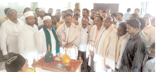
ఎమ్మెల్యేను సన్మానిస్తున్న ముస్లిం నాయకులు