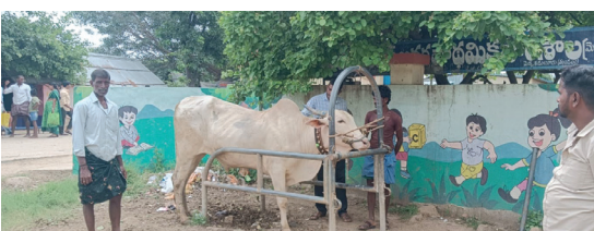
హెచ్. మురువణిలో ఆరుబయలు పశువులకు వైద్యం చేస్తున్న వైద్య సిబ్బంది

ఉన్న భవనానికి నిధులు కేటాయించాలని అంతేకాకుండా పశువులకు ఇంకా మరికొన్ని మందులు సరఫరా చేయాలని గ్రామస్థులు జిల్లా పశువైద్యాధికారి కారులను కోరారు.