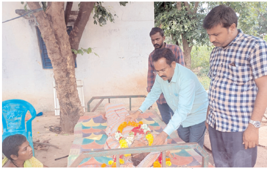
మృతి చెందిన గిరిజనుడు కి నివాళులు అర్పిస్తున్న ఐటీడీపీ అధికారులు