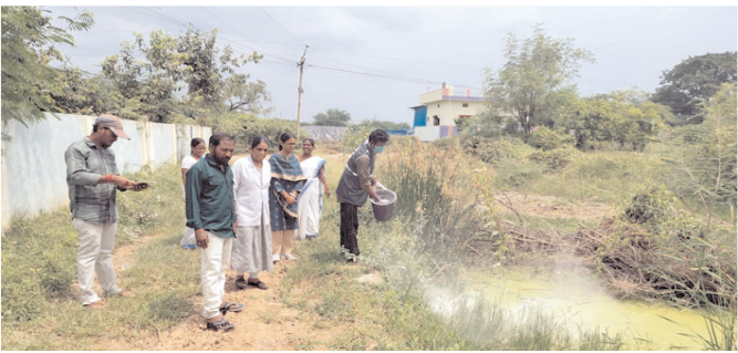
పారిశుధ్యం పనులు నిర్వహిస్తున్న వైద్య సిబ్బంది