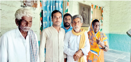
మాట్లాడుతున్న బాధిత రైతుకుటుంబం

- తహశీల్దార్ కార్యాలయంలో వాగ్వివాదం - ఆందోళనలో రైతులు