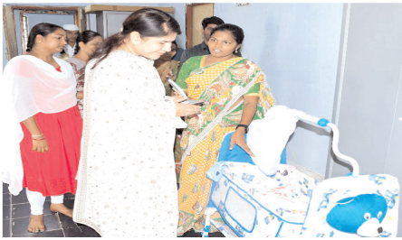
చిన్నపిల్లల ఊయలను పరిశీలిస్తున్న కలెక్టర్ రాజకుమారి

నంద్యాల కల్చరల్, మేజర్ న్యూస్ : శిశు గృహంలోని పిల్లల సంరక్షణకు ప్రత్యేక శ్రద్ధ తీసుకోవాలని జిల్లా కలెక్టర్ రాజకుమారి స్త్రీ శిశు సంక్షేమ అధికారులను