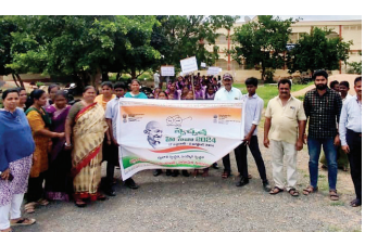
ర్యాలీ నిర్వహిస్తున్న విద్యార్థులు