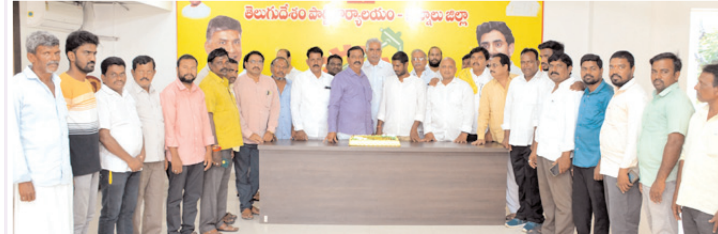
బర్డ్ కేక్ కట్ చేస్తున్న దృశ్యం