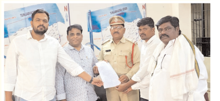
ఫిర్యాదు అందజేస్తున్న దృశ్యం