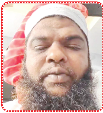
ఆత్మహత్యకు ముందు తీసుకున్న సెల్ఫీ

నంద్యాల క్రైం, మేజర్ న్యూస్ : ఆన్లైన్లో డబ్బులు పెడితే అధిక మొత్తంలో లాభాలు వస్తాయని నమ్మి చివరకు మోసపోయి ప్రాణాలు తీసుకున్నాడు ఓ ఉపాధ్యాయుడు. మంగళవారం సాయంత్రం తన ఇంట్లో ఫ్యాన్ కు ఉర్రేసుకుని ఉసురుతీసుకున్నాడు. అందరితో కలుస్తూ సరాదాగా ఉండే వ్యక్తి ఒక్కసారిగా ఆత్మహత్యకు పాల్పడడంతో పట్టణంలోని సలీంనగర్ ప్రాంతంలో విపాదచాయలు