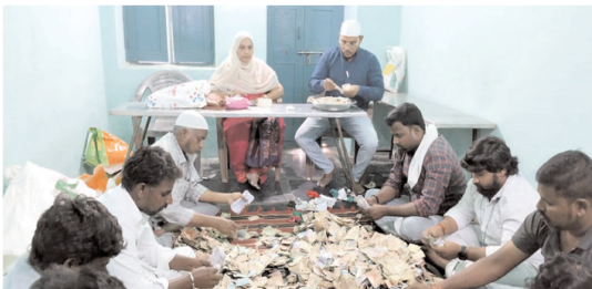
హుండీల లెక్కింపు దృశ్యం

హాళగుండ్, మేజర్ న్యూస్ : హాళగుండ్ మండలం ఎల్లార్ల గ్రామంలో కొలువైన హజరత్ శేక్సావలి, హజరత్ షాహావలి తాతల దర్గాలో బుధవారం వక్రబోర్డు శాఖా అధికారులు హుండీలు లెక్కించారు. రెండు దర్గాలకు సంబంధించిన హుండీలను జిల్లా మైన్స్ట్రీ వెల్లర్