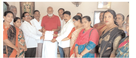
వినతివత్రం అందజేస్తున్న దృశ్యం

కర్నూలు ఎడ్యుకేషన్, మేజర్ న్యూస్: రాష్ట్రంలో త్వరలో జరుగనున్న నామినేటెడ్ పదవుల కేటాయింపుల్లో తమకు ప్రాధాన్యత కల్పించేలా చూడాలని బలిజ, కాపు సంఘం కర్నూలు నగర పాలిటికల్ వింగ్ జేపీసీ కోరింది. ఈ మేరకు బుధవారం జనసేన పార్టీ రాయల