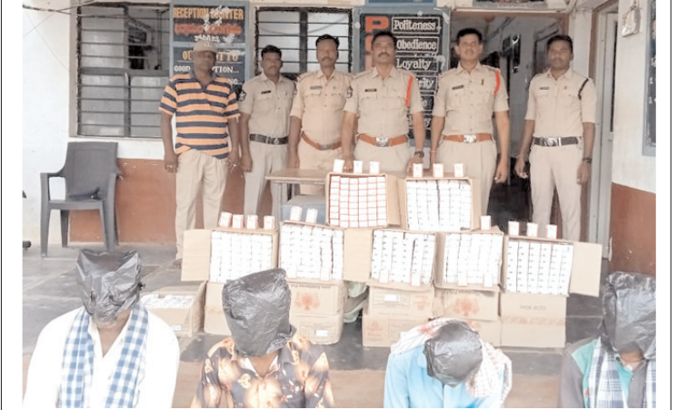
కర్ణాటక మద్యంతో పోలీసులు