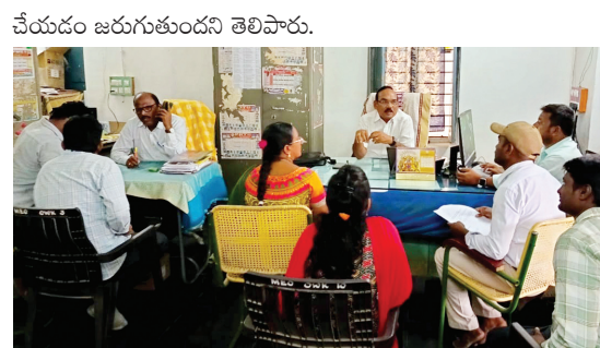
చేయడం జరుగుతుందని తెలిపారు.