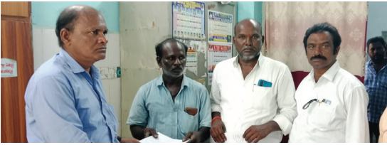
తహశీల్దార్ కు వివరించిన తన పొలం వివరాలు