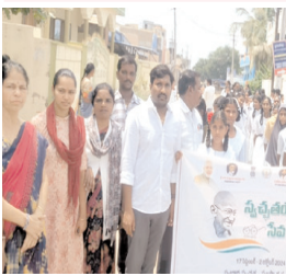
ర్యాలీ నిర్వహిస్తున్న దృశ్యం

కల్లూరు, మేజర్ న్యూస్: గ్రామాల్లో పరిశుభ్రతకు ప్రాధాన్యత ఇవ్వాలని ఎంపీ డి.ఎం. చంద్రశేఖరరెడ్డి అన్నారు. మండలంలోని చిన్నచేకూరు, బస్టిపాడు గ్రామాల్లో స్వచ్ఛతా హీ సేవా కార్యక్రమంలో