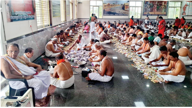
శ్రీమఠంలో హుండీ లెక్కింపులో పాల్గొన్న పురుషులు