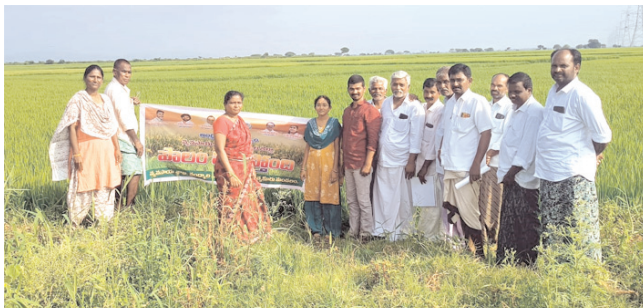
ఏ కోడూరు లో పాలం పిలుస్తుంది కార్యక్రమంలో పాల్గొన్న దృశ్యం

వాడాలని సూచించారు. సల్ఫర్ వాడగానే తగ్గించడం ద్వారా వేరు కుళ్ళును నియంత్రించవచ్చున్నారు. ప్రభుత్వం ప్రతిష్టాత్మకంగా నిర్వహిస్తున్న పాలం పిలుస్తుంది కార్యక్రమాన్ని మండలంలో మంగళ బుధవారంలో నిర్వహిస్తున్నట్లు ఈ సందర్భంగా వారు తెలిపారు. ఈ కార్యక్రమంలో ఏఎం లు సామ్రాట్, వెటర్నరీ సిబ్బంది, రైతులు పాల్గొన్నారు.