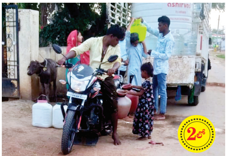
గ్రామస్థులు మినరల్ వాటర్ సప్లై ఆటో వద్ద త్రాగునీరు తీసుకెళ్లుతున్న దృశ్యం