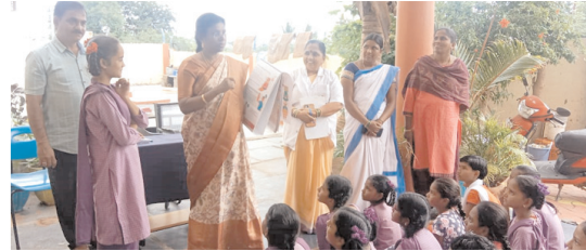
అవగాహన కల్పిస్తున్న దృశ్యం