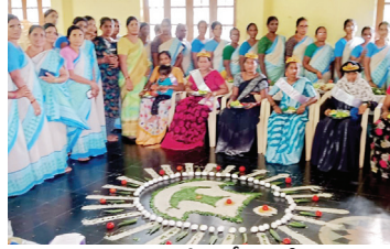
ఐసీడీఎస్ అధ్యక్షులతో గర్భిణీలకు శ్రీమంతాలు నిర్వహించారు. ఈ సందర్భంగా పోషణ అభివృద్ధికి తోడ్పడే ఆహార, పదార్థాలు, ఆకుకూరలు, రకరకాల పిండి వంటలతో, మిల్కెట్స్ ఉపయోగించి చేసే వంటకాలను