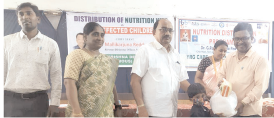
హెచ్ఐవి పాజిటివ్ బాధిత చిన్నారులకు కిట్లను అందజేస్తున్న దృశ్యం