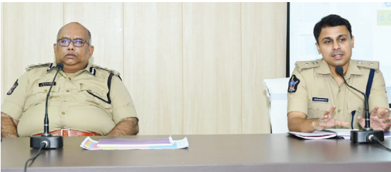
సమావేశంలో మాట్లాడుతున్న కర్నూలు రేంజ్ డివిజన్ కోయ ప్రవీణ్