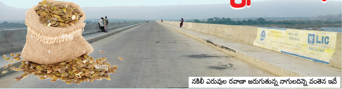
సకిలీ ఎరువుల రవాణా జరుగుతున్న నాగులదిన్నె వంతెన ఇదే