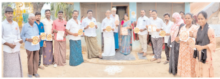
ఇది మంచి ప్రభుత్వం కార్యక్రమంలో టిడిపి నాయకులు