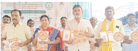
ఇది మంచి ప్రభుత్వం కరపత్రాలను అభివృద్ధిస్తున్న దృశ్యం

తెలిపారు. చంద్రబాబు ప్రమాణ స్వీకారం చేసిన వెంటనే రాష్ట్రంలో 64 లక్షల మంది సామాజిక పింఛన్ దారులకు రూ. 3వేల నుంచి రూ. 4వేలు అందజేశారన్నారు పేదల ఆకలిని