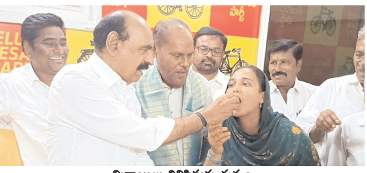
మిఠాయిలు తినిపిస్తున్న దృశ్యం