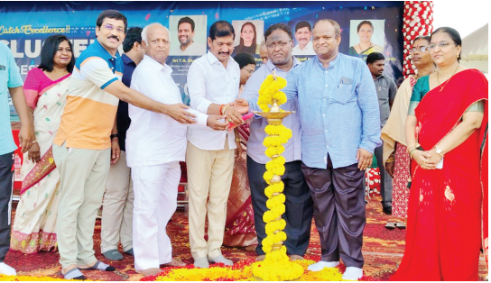
కోశ్రి ప్రజ్వలన చేసిన ఫుట్ బాల్ పోటీలను ప్రారంభిస్తున్న దృశ్యం

- ప్రారంభించిన కర్నూలు ఎంపీ బిస్మిపాటి నాగరాజు