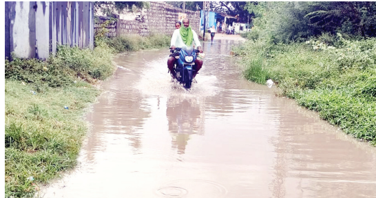
జాతీయ రహదారిపై డ్రైనేజీ లేక కాలనీల్లో నిలుస్తున్న వర్షపునీరు..

వర్షపు నీటితో మునిగిన హర్నిలో రోడ్లు హాలహర్ని, మేజర్ న్యూస్ : మండల కేంద్రమైన హాలహర్ని లో హర్నిలో రోడ్డులో చిన్నపాటి వర్షానికి రోడ్లపై వర్షపు నీరు నిలిచి వాహనదారులు కు ఇబ్బందులు కలుగజేస్తుంది. ఆదివారం కురిసిన