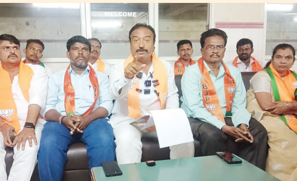
సమావేశంలో మాట్లాడుతున్న బిజెపి జిల్లా అధ్యక్షుడు