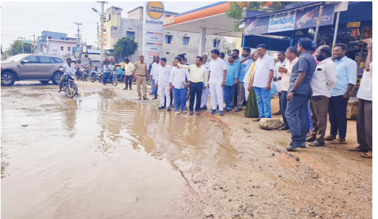
రోడ్డును పరిశీలిస్తున్న ఎమ్మెల్యే బీవీ

పరిశీలించిన ఎమ్మెల్యే బీవీ ఎమ్మిగునూరు టౌన్, మేజర్ న్యూస్ : వర్షం కారణంగా దెబ్బతిన్న రహదారులన్నీ బాగు చేసి చూపిస్తామని ఎమ్మెల్యే బీవీ జయనాగేశ్వరరెడ్డి అన్నారు. బుధవారం పట్టణంలోని మరమ్మతులకు గురైన శివ సర్కిల్, కర్నూలు బైపాస్ రోడ్డు రహదారులను ఆయన