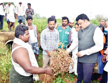
పంటలను పరిశీలిస్తున్న కలెక్టర్

తుగ్గలి, మేజర్ న్యూస్: తుగ్గలి మండలంలో అధిక వర్షాల వల్ల దెబ్బతిన్న పంటల వివరాలను, నష్టపోయిన రైతుల వివరాలను సిద్ధం చేయాలని జిల్లా కలెక్టర్ పి. రంజిత్ బాష అధికారులను ఆదేశించారు. బుధవారం మండలంలోని