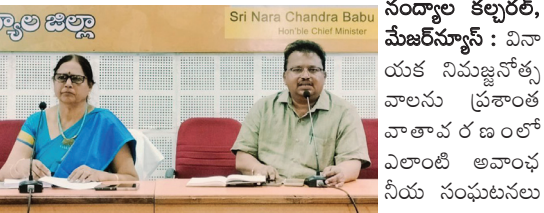
నంద్యాల కల్చరల్, మేజర్ న్యూస్ : వినాయక నిమజ్జనోత్సవాలను ప్రశాంత వాతావరణంలో ఎలాంటి అవాంఛనీయ సంఘటనలు జరగకుండా శాంతి