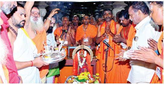
శ్రీశైలం, మేజర్ న్యూస్ : లోక కల్యాణం కోసం శ్రీశైలం దేవస్థానం శ్రావణ మాసం సందర్భంగా నిర్వహించిన శివచతుస్సప్తాహ భజనలు

భాద్రపద శుక్ల పాడ్యమి రోజు బుధవారంతో ముగిసాయి. ఈ భజన కార్యక్రమంలో శ్రావణ మాసముతా కూడా నిరంతరంగా రేయింబ వళ్ళు అఖండ శివపంచాక్షరి నామభజనను చేయడం జరిగింది. ఆలయ ప్రాంగణములోని వీరశిరోమండలంలో ఈ విశేష కార్యక్రమం నిర్వహించబడింది. కాగా కర్నూలు నగరానికి చెందిన అయిదు భజన బృందాలకు, కర్ణాటకకు చెందిన మూడు భజన బృందాలకు ఈ శ్రావణమాసం శివభజనలు చేయడానికి అవకాశం కల్పించబడింది. కాగా పవిత్ర శ్రావణ మాసంలో శివనామస్మరణ అత్యంత విశిష్టమైనదిగా చెప్పబడుతోంది. ఈ విషయాన్ని దృష్టిలో ఉంచుకుని లోక కల్యాణం కోసం ప్రతీ సంవత్సరం శ్రావణ మాసములో దేవస్థానం అఖండ శివచతుస్సప్తాహ భజనలు నిర్వహిస్తోంది.