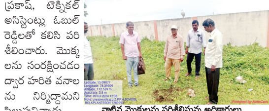
నాటిన మొక్కలను పరిశీలిస్తున్న అధికారులు