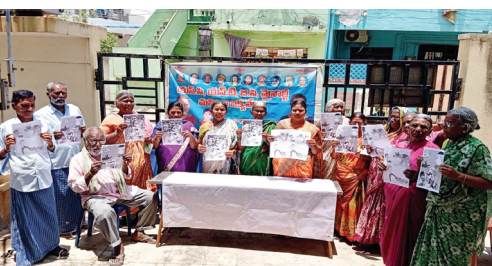
నిరసన వ్యక్తం చేస్తున్న దృశ్యం

వ్యక్తం చేశారు. ఈ సందర్భంగా ఆమె మాట్లాడుతూ నగరంలో జంతు సంరక్షణ కేంద్రాన్ని ఏర్పాటు చేయాలన్నారు. రాష్ట్ర ప్రభుత్వం కుక్కల జనన నివారణ శస్త్రచికిత్సలను చేపట్టాలన్నారు. ప్రజలు కూడా జాగ్రత్తలు పాటించాలని సూచించారు.