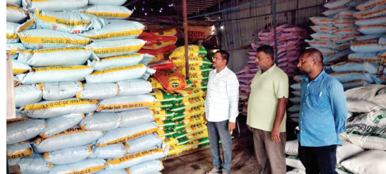
బుక్కాపురం ఎరువుల దుకాణంలో ఎరువులను పరిశీలిస్తున్న దృశ్యం