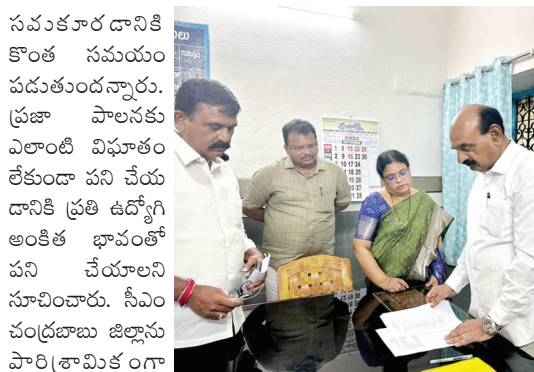
సమకూర దానికి కొంత సమయం పడుతుందన్నారు. ప్రజా పాలనకు ఎలాంటి విఘాతం లేకుండా పని చేయ దానికి ప్రతి ఉద్యోగి అంకిత భావంతో పని చేయాలని సూచించారు. సీఎం చంద్రబాబు జిల్లాను పారిశ్రామికంగా

నంద్యాల, మేజర్ న్యూస్ బ్యూరో : ఉద్యోగులు అంకిత భావంతో పని చేయాలని రాష్ట్ర న్యాయ, మైనార్టీ శాఖ మంత్రి ఎన్ఎండి ఫరూక్ పేర్కొన్నారు. నంద్యాల జిల్లా కొత్తగా ఏర్పడిందని ప్రతి ఒక్క అధికారి నిబద్ధతతో పని చేయాలని కోరారు. గతం జోలికి వెళ్ళనని, ఇప్పటి నుంచి అధికారులు నిష్పక్షపాతంగా పని చేయాలన్నారు. నంద్యాల అభివృద్ధికి కట్టుబడి ఉన్నానన్నారు. కొత్త జిల్లా కావడంతో జిల్లా అధికారులు కార్యాలయాలు లేక ఇబ్బందులు పడుతున్నారన్నారు. ప్రస్తుతం కలెక్టర్ కార్యాలయం ప్రజలకు దూరంగా ఉందని, టెక్సా మార్కెట్ యార్డులో ఏర్పాటు చేస్తే ఎలా ఉంటుందన్న దానిపై చర్చిస్తున్నామన్నారు. నంద్యాల మండల ప్రజా పరిషత్ కార్యాలయంలో మండల అధ్యక్షులు ప్రభాకర్ అధ్యక్షతన బుధవారం సర్వ సభావే శం నిర్వహించారు. ముఖ్య అతిథిగా హాజరైన మంత్రి ఫరూక్ మాట్లాడుతూ క్షేత్ర స్థాయిలో సమస్యలను పరిష్కరించే దిశగా అధికారులు పని చేయాల్సి ఉందన్నారు. గ్రామస్థాయి ప్రజాప్రతినిధులు సర్వ సభ్య సమావేశంలో ప్రస్తావించిన సమస్యలపై తక్షణ స్పందన ఉండాలన్నారు. ఆర్థిక పరమైన కొన్ని సమస్యలను నిర్దిష్టమైన నివేదికల ద్వారా అందజేయడంతో వాటిపై ప్రభుత్వం నిశిత పరిశీలన చేసి అందు కోసం పరిష్కారం దిశగా పని చేస్తుందన్నారు. నంద్యాల జిల్లా సూతనంగా ఏర్పడిందే కానీ ఇందుకు అవసరమైన వసతులు, వసరులు