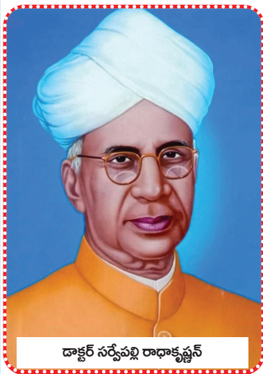
డాక్టర్ సర్వేపల్లి రాధాకృష్ణన్

నంద్యాల టౌన్ మేజర్ న్యూస్: భారతీయ సంప్రదాయంలో తల్లిదండ్రుల తర్వాత అత్యంత పూజనీయంగా భావించే వ్యక్తి గురువు. 'అచార్యదేవోభవ' అంటూ విద్యాబుద్ధులు నేర్పిన గురువులను కీర్తిస్తాం. నిజం చెప్పుకోవాలంటే.. మన తల్లిదండ్రుల కంటే గురువులకే మన గురించి ఎక్కువ తెలుసు అనడంలో ఎలాంటి సందేహం లేదు. మన తెలివితేటలు, ఆలోచనల గురించి గురువులకే పూర్తిగా తెలుస్తుంది. చదువు మీద శ్రద్ధ తగ్గినట్లు నిశించినా.. మనసు పక్క దారి పట్టినట్లు గుర్తించినా దండిస్తారు. సరైన దారిలో నడిపిస్తారు. అందుకే గురువును మించిన దైవం లేదంటారు. గౌరవనీయమైన ఉపాధ్యాయ వృత్తిలో ఉంటూ ఎంతో మంది జీవితాలను తీర్చిదిద్దుతోన్న గురువులను గౌరవించేందుకే మనం