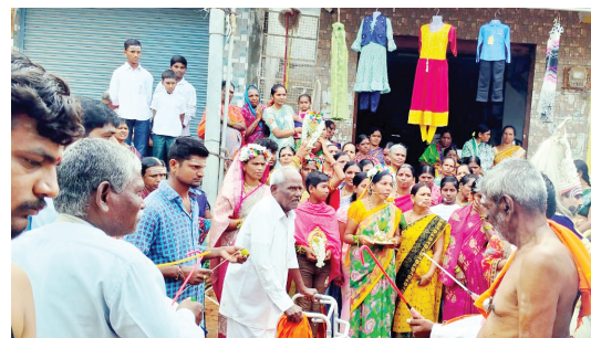
కుంభోత్సవం నిర్వహిస్తున్న దృశ్యం

ఆకట్టుకున్నాయి. దేవాలయంలో ఆలయ అర్చకులు స్వామివారికి ప్రత్యేకంగా పూజలు, ఆలంకరణ విశేషంగా చేశారు. భక్తులు అధిక సంఖ్యలో హాజరయ్యారు. వచ్చిన భక్తులకు అర్చకులు తీర్ధప్రసాదాలు అందించారు. భక్తులకు అన్నాప్రసాదం ఏర్పాటు చేశారు.