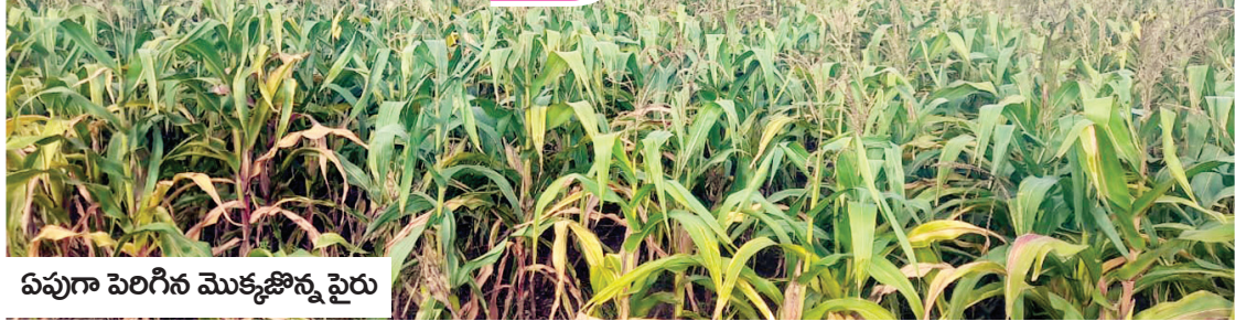
ఏపుగా పెరిగిన మొక్కజొన్న పైరు