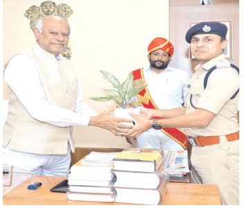
పూలమొక్క అందజేస్తున్న దృశ్యం