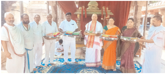
అధికారులకు పట్టు చీరలను అందజేస్తున్న దాతలు