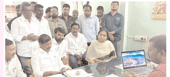
కార్యాలయాన్ని సందర్శిస్తున్న కర్నూలు ఎంపీ బిసినాటి నాగరాజు

కల్లూరు, మేజర్ న్యూస్: ప్రభుత్వ కార్యాలయాలకు వచ్చే ప్రజల పట్ల అధికారులు మర్యాదపూర్వకంగా నడుచుకొని, వారికి అన్ని విధాలుగా సేవలు అందించాలని కర్నూలు ఎంపీ