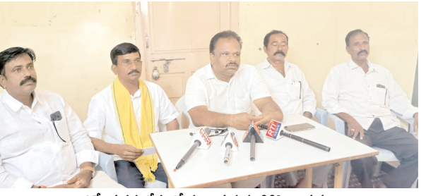
విలేఖర్ల సమావేశంలో మాట్లాడుతున్న టీడీపీ నాయకులు

అన్నారు. దిగువకాలువ అధికారుల అందించిన లెక్కలు చూపుతూ విమర్శలు చేయడం సబబు కాదన్నారు. గురురాఘవేంద్ర పథకం నీళ్లు ప్రస్తుతం రైతులకు వర్షాల వల్ల అవసరం లేకుండా అన్న విషయం తెలుసుకోవాలన్నారు. దివంగత మాజీ మంత్రి బివి