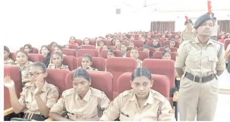
హాజరైన ఎన్సీసీ విద్యార్థినులు

దాదాపు 62 సీట్లు ఉన్నాయని వాటిని వినియోగించుకుని ఆత్మవిశ్వాసం పెంపొందించు