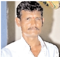
మృతి చెందిన రైతు (ఫైల్)