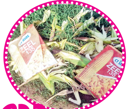
వేసిన మొక్కజొన్న విత్తనాల సంచలనం బాజీ మొక్కజొన్న కండెలు