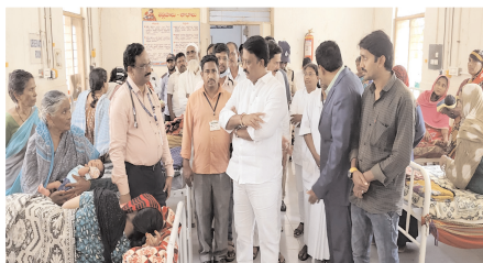
రోగులను సమన్వయ అడిగి తెలుసుకుంటున్న ఎమ్మెల్యే బుడ్డా

ఆసుపత్రిలో రోగులు ఇబ్బంది పడకుండా ఉండేలా నీటి సరఫరా అందించాలని మున్సిపల్ అధికారులను ఆదేశించారు. అలాగే సిసి కెమెరాలు, ఆరోగ్య వాటర్ షాంట్లను సొంత నిధులతో ఏర్పాటు చేస్తానని అన్నారు. ఆసుపత్రికి రోగులు ఎంతో ఆశతో మెరుగైన వైద్యం అందుతుందని రాత్నక, పగలనకు వస్తుంటారని, వారి పట్ల వైద్యులు, సిబ్బంది అవ్యాయతగా పలకరిస్తూ మెరుగైన వైద్య సేవలందించాలని అన్నారు. దేవుడి తర్వాత స్థానం వైద్యులకే ఉందనే విషయాన్ని తెలుసుకొని