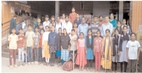
క్రీడాకారులకు వీడ్కోలు పలుకుతున్న దృశ్యం

కర్నూలు స్పోర్ట్స్, మేజర్ న్యూస్: ఈ నెల 14వతేదీ నుంచి 15వరకు విశాఖపట్నం జిల్లా భీమిలిలో జరుగబోయే 49వ రాష్ట్రస్థాయి యోగా పోటీలలో కర్నూలు జిల్లా క్రీడాకారులు