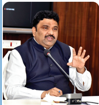
మాట్లాడుతున్న జిల్లా కలెక్టర్ రంజిత్ బాషా

కర్నూలు, మేజర్ న్యూస్ : సెప్టెంబరు 17వ తేదీ నుంచి అక్టోబరు 2వ తేదీ వరకు నిర్వహించే స్వచ్ఛతా హి సేవా కార్యక్రమంలో రోజువారీగా నిర్వహించే కార్యక్రమాల ప్రణాళికను సిద్ధం చేయాలని జిల్లా కలెక్టర్ పి.రంజిత్ బాషా సంబంధిత అధికారులను ఆదేశించారు. గురువారం స్వచ్ఛతా హి సేవ కార్యక్రమానికి సంబంధించి సంబంధిత