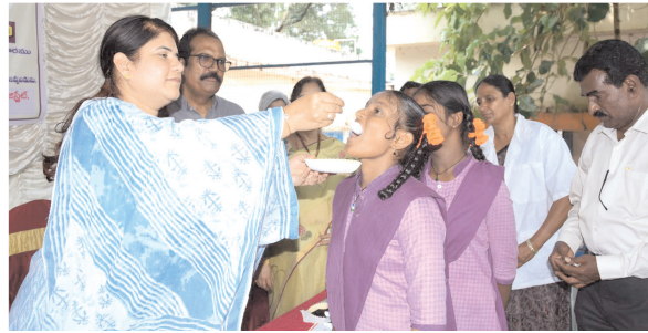
ఆల్పైండజోల్ మాత్రలను విద్యార్థులకు వేస్తున్న కలెక్టర్ రాజకుమారి

నివారణ మాత్రలను మింగించేలా చర్యలు తీసుకోవాలని