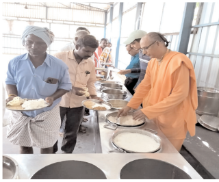
భోజనం వడ్డిస్తున్న దృశ్యం