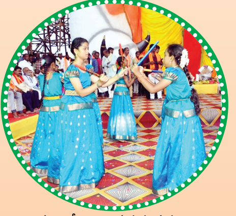
చిన్నారులు కోలాటం ఆడుతున్న దృశ్యం