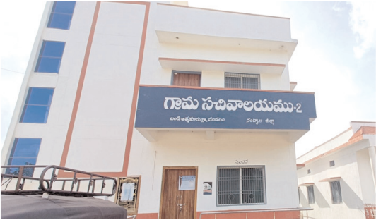
కార్యకలాపాలకు నోచుకోని సచివాలయాల

అవుతున్నా ఇప్పటివరకు కార్యకలాపాలకు నోచుకోక పోవడం పట్ల గ్రామ ప్రజలు తీవ్ర అసంతృప్తి వ్యక్తం