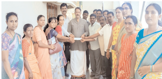
ముఖ్యమంత్రి సహాయ నిధికి ఎమ్మెల్యే బుద్ధాకు విరాళం చెక్కును అందజేస్తున్న దృశ్యం

ఆత్మకూరు, మేజర్ న్యూస్: విజయవాడ వరద బాధితులకు