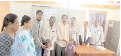
మాత్రలు పంపిణీ చేస్తున్న దృశ్యం