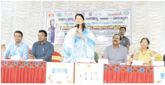
నమావేశంలో మాట్లాడుతున్న జిల్లా కలెక్టర్ రాజకుమారి

నివారణ మాత్రలను మింగించేలా చర్యలు తీసుకోవాలని