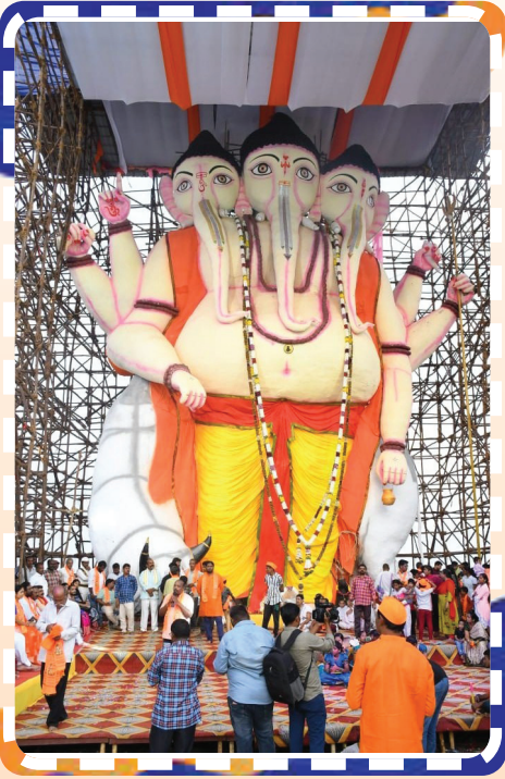
63 అడుగుల మట్టి వినాయకుడు