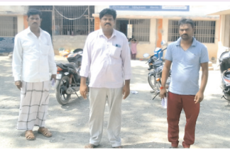
ఓర్వకల్లు మేజర్ న్యూస్ :