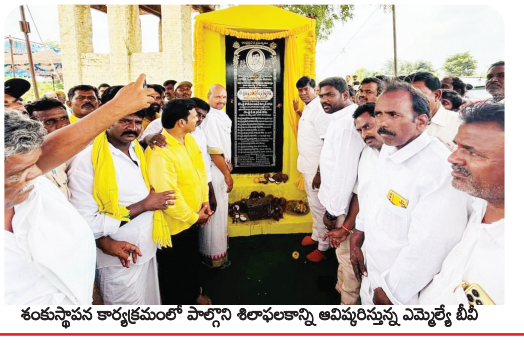
శంకుస్థాపన కార్యక్రమంలో పాల్గొని శిలాఫలకాన్ని అవిష్కరిస్తున్న ఎమ్మెల్యే బీపీ