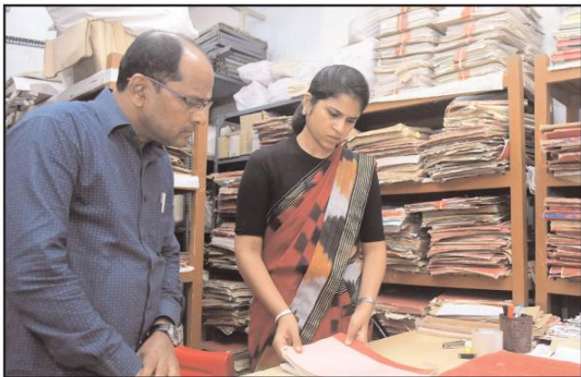
సంగారెడ్డి మేజర్ న్యూస్ ప్రతినీధి : సీజనల్ వ్యాధుల పట్ల ప్రజలు అప్రమత్తంగా ఉండాలి జిల్లా కలెక్టర్ క్రాంతి వల్లూరు అన్నారు. శనివారం కలెక్టర్ క్రాంతి