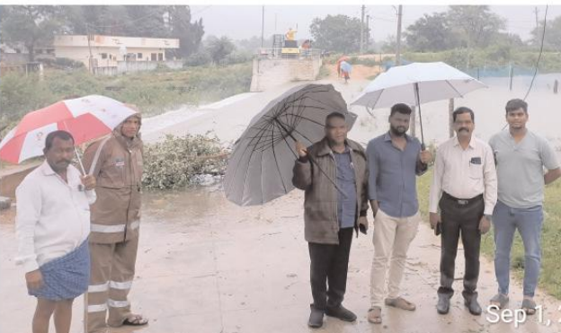
ఉండాలని అధికారులు సూచించారు.

జిన్నారం మేజర్ న్యూస్:జిన్నారం మండలంలో గత రెండు రోజులుగా కురుస్తున్న భారీ వర్షాలకు చెరువులు కుంటులు నీటి కలసు సంతరించుకున్నాయి.మండల కేంద్రంలోని అక్కమ్మ చెరువు భారీ వర్షాలకు మత్తడి దూకింది. అదేవిధంగా వావిలాల చెరువు భారీ వర్షాలకు నిండుకుండలా మారి మత్తడి దూకింది. మత్తడి దూకిన విషయం తెలుసుకున్న తాసిల్దార్ బిక్షపతి చెరువును పరిశీలించారు. అదేవిధంగా ఊట్ల గ్రామంలో భారీగా నిండుకున్న చెరువుకు ప్రమాదం పొంది ఉందని గ్రామస్థులు ఆందోళన వ్యక్తం చేశారు. కాగా భారీ వర్షాలు నేపథ్యంలో మండల ప్రజలంతా అప్రమత్తంగా