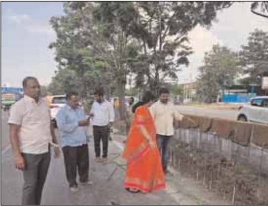
కర్నూల్ ఘాట్ ,మేజర్ న్యూస్ :డివైడర్ నిర్మాణంలో నాణ్యత ప్రమాణాలు పాటిస్తూ ప్రజలకు ఎలాంటి ఇబ్బందులు కలగకుండా , ట్రాఫిక్ సమస్య రాకుండా పనులు చేపట్టాలన్నారు .సాగర్ రింగ్

● పనులలో నాణ్యత ప్రమాణాలు పాటించాలి ● కార్పొరేటర్ బానోత్ సుజాత నాయక్