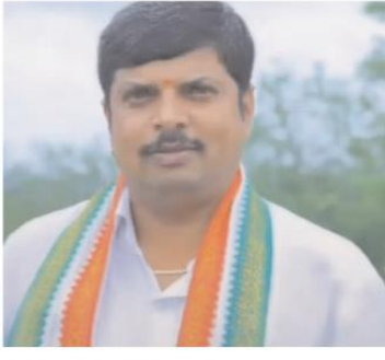
హార్షం వ్యక్తం చేస్తున్నారు.

రాయకోడ్, సూర్య మేజర్ న్యూస్ మండలంలోని సింగీతం గ్రామానికి ప్రాథమిక ఆరోగ్య కేంద్రం పి హెచ్ సి ఉపా కేంద్రానికి 2.45 కోట్ల నిధులు మంజూరు చేసి మరియు విడుదల చేస్తూ జీవో జారీ చేసిన రాష్ట్ర వైద్య ఆరోగ్య శాఖ మంత్రి వర్యలు మంత్రి దామోదర్ రాజనర్సింహ గారికి కృతజ్ఞతలు తెలిపారు. మరియు మా సింగీతం గ్రామం తరపున ప్రత్యేక ధన్యవాదములు తెలిపారు. ప్రాథమిక ఆరోగ్య కేంద్రం అందుబాటులో ఉన్న సింగీతం గ్రామంలో ఏర్పడుతుండడం తో చుట్టు పక్కల ఆయా గ్రామాల ప్రజలు