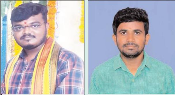
అధ్యక్షులు జోగు రవీందర్