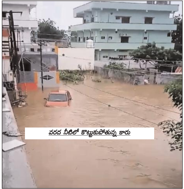
వరద నీటిలో కొట్టుకుపోతున్న కారు