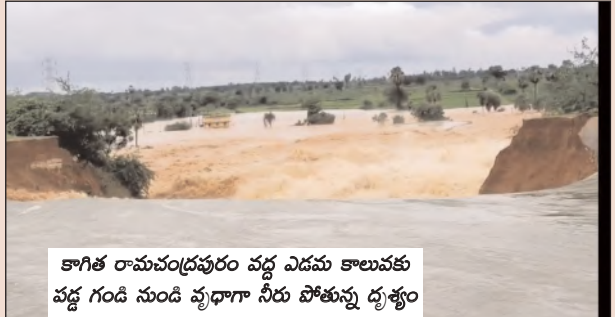
కాగిత రామచంద్రపురం వద్ద ఎడమ కాలువకు పడ్డ గండి నుండి వృధాగా నీరు పోతున్న దృశ్యం

కోదాడ, మేజర్ న్యూస్ : ఉత్తర బంగాళాఖాతంలో ఏర్పడ్డ వాయుగుండం ప్రభావంతో సూర్యాపేట జిల్లాలో భారీగా పడుతున్న వర్షాల నేపథ్యంలో ఇప్పటికే నాగార్జునసాగర్ ఎడమ కాలువ ద్వారా నిండుగా వస్తున్న నీటి ప్రవాహం తోడు వరద నీరు కలవడంతో శనివారం సూర్యాపేట జిల్లా నడిగూడెం మండలం కాగిత రామచంద్రపురం వద్ద ఎడమ కాలువకు భారీ గండి పడింది. ఆ గండికి మరో కిలోమీటర్ దూరంలోనే రంగుల బ్రిడ్జి వద్ద మరో గండి పడింది. దీంతో రామచంద్రపురం గ్రామాన్ని వరద నీరు చుట్టుముట్టింది. గ్రామస్థులంతా భయాందోళనతో ఉన్నారు. గండిపడటంతో చాలా వరకు పంట పొలాలు మునిగిపోయాయి. ఎన్ఎస్పి అధికారులు ప్రమాద స్థలానికి వెళ్లి పర్యవేక్షిస్తున్నారు. కాగా గండిపడ్డ ప్రదేశాలను నేడు మంత్రి ఉత్తంకుమార్ రెడ్డి పరిశీలించనున్నారు.