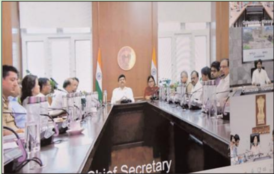
ఉమ్మడి నల్గొండ జిల్లా ట్యూర్

పౌర సంబంధాల శాఖ మంత్రి పొంగులేటి శ్రీనివాస్ రెడ్డి