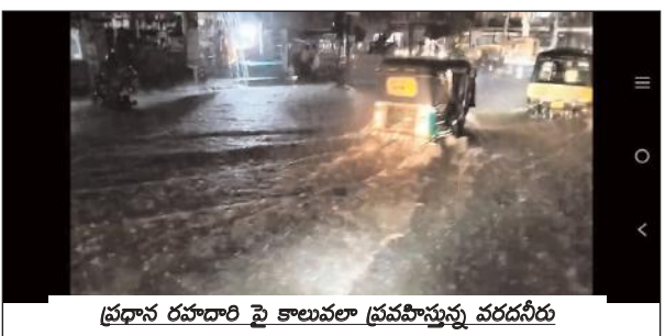
ప్రధాన రహదారి పై కాలువలా ప్రవహిస్తున్న వరదనీరు