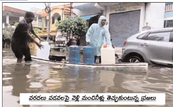
వరదలు వడవలపై వెళ్లి మంచినీళ్లు తెచ్చుకుంటున్న ప్రజలు