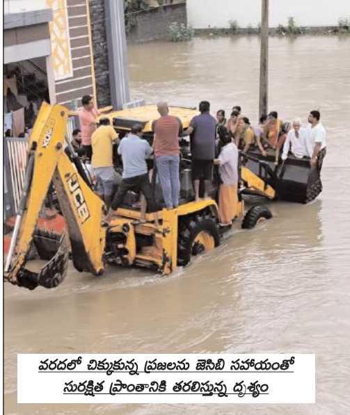
వరదలో చిక్కుకున్న ప్రజలను జెసిబి సహాయంతో సురక్షిత ప్రాంతానికి తరలిస్తున్న దృశ్యం