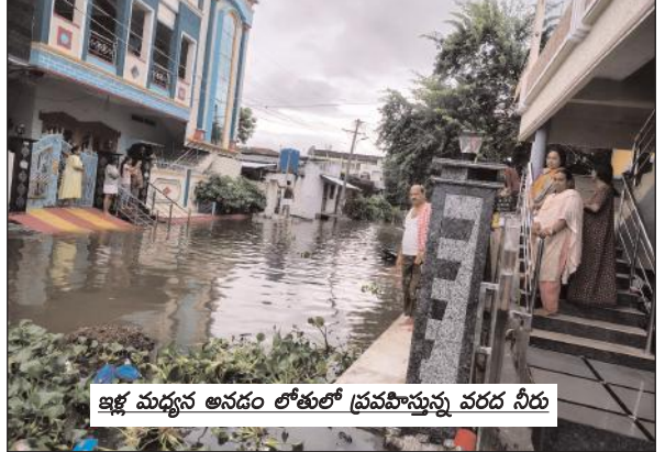
ఇళ్ల మధ్యన అనడం లోతులో ప్రవహిస్తున్న వరద నీరు