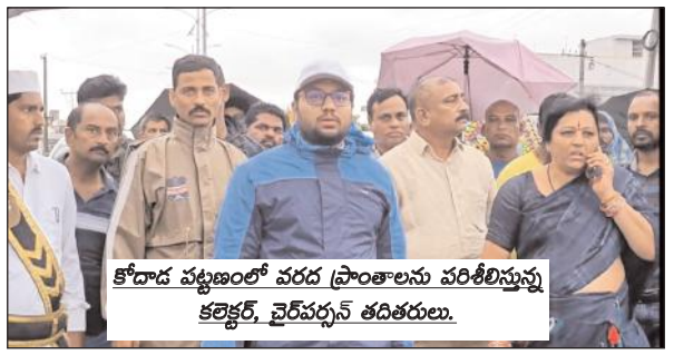
కోదాడ పట్టణంలో వరద ప్రాంతాలను పరిశీలిస్తున్న కలెక్టర్, చైర్పర్సన్ తదితరులు.