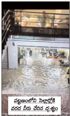
పట్టణంలోని నెల్లార్లోకి వరద నీరు చేరిన దృశ్యం