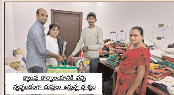
క్యాంపు కార్యాలయానికి వచ్చి స్వచ్ఛందంగా దుస్తులు ఇస్తున్న దృశ్యం

కోదాడ, మేజర్ న్యూస్ : ఇప్పటివరకు వరదలు, ఆస్తి, ప్రాణనష్టాలు అంటే ఏంటో కోదాడ నియోజకవర్గ ప్రజలకు తెలియదు. గతంలో ఎన్నో ప్రకృతి వైపరీత్యాలు వచ్చిన ప్రజలు వనక లేదు తోనక లేదు, నష్టం కలగలేదు. కాగా గత నెల 31న వచ్చిన భారీ వర్షాలకు వరద తీరని సప్టాన్ని సోకాన్ని మిగిలించాయి. ఆస్తి, ప్రాణ నష్టంతో పాటు కట్టుబట్టలతో వంద లాది మంది ప్రజలు నిరాశ్రయుల య్యారు. కట్టు బట్టలతో బయటకు వచ్చిన వారికి కనీసం తినడానికి తిండి కూడా లేని పరిస్థితి ఏర్పడింది. వారి గుండె కోతకు, వారి కన్నీటికి చలించిన కోదాడ నియోజకవర్గ ప్రజలకు అమ్మ అయినా ఎమ్మెల్యే పద్మావతిమ్మ హృదయం కలిసి వేసింది. దీంతో ప్రభుత్వ పరంగా చేయాల్సిన పనులు, సహాయం చేస్తానే, కట్టు బట్టలు కోల్పోయిన బిడ్డల కోసం అమ్మ ఒక పిలుపునిచ్చారు. ఆమె పిలుపు ఒక ప్రభంజనమై అనుహ స్పందన లభించింది. అనేకమంది ప్రజలు, స్వచ్ఛందం సంఘాల వారు అన్ని రకాల బట్టలు స్వచ్ఛందంగా క్యాంప్ కార్యాలయానికి తీసుకొచ్చి ఇస్తున్నారు. అది అమ్మ మాట అంటే గౌరవం. స్వచ్ఛందంగా వచ్చిన దుస్తులను సర్వం కోల్పోయిన తొగ్రాయి, కూచిపూడి గ్రామాలతోపాటు కోదాడ పట్టణంలోని వరదలో నీట మునిగి నా బాధితులకు దుస్తులను పంపిణీ చేసేందుకు అమ్మ ఎమ్మెల్యే ఒక ప్రణాళి కను రూపొందించింది. వరదతో నిరాశ్రయమైన బాధితుల కోసం అమ్మ చేస్తున్న అహర్నిశ కృషికి ఇప్పటికే పలువురు నుండి ప్రశంసలు అందుతున్నాయి. ఇది కదా ఒక ప్రజా ప్రతినిధి ప్రజలను సొంత బిడ్డలుగా భావించి వారి కష్టసుఖాల్లో పాలుపంచుకుంటున్న ఓ మహిళా ఎమ్మెల్యే కృషికి ప్రజలు నీరాజనం పలుకుతున్నారు.