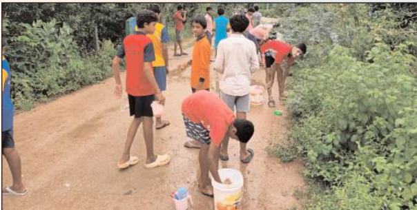
హాస్టల్ బయట వరదలో రోడ్డుపైన కాలకృత్యాలకు వచ్చిన విద్యార్థులు