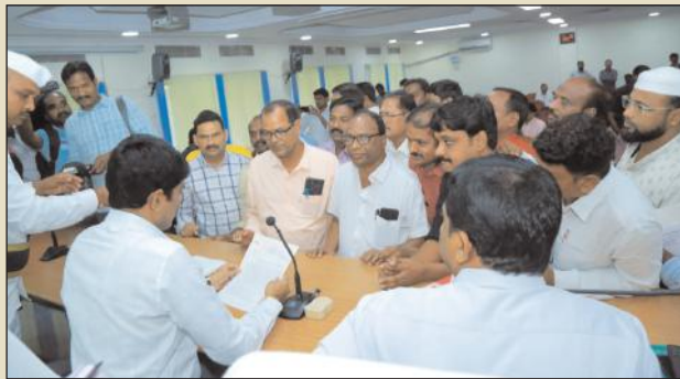
నల్గొండ జిల్లా బ్యూరో