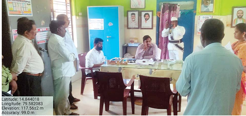
Latitude: 14.844018 Longitude: 79.582083 Elevation: 117.56±2 m Accuracy: 99.0 m