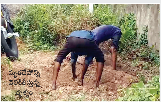
మృతదేహాన్ని వెలికితీస్తున్న దృశ్యం