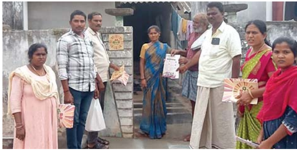
ఆయా గ్రామాలు, వార్డులు తెలుగుదేశం నాయకులు, సచివాలయ సిబ్బంది ఈకార్యక్రమాన్ని నిర్వహించారు. వారు ఇంటింటికెళ్ళి ప్రజలకు ప్రభుత్వం విడుదల చేసిన 100రోజుల పాలనా వివరాలను తెలిపే కరపత్రాలను పంపిణీ చేయడంతోపాటు వివరాలను తెలిపారు.