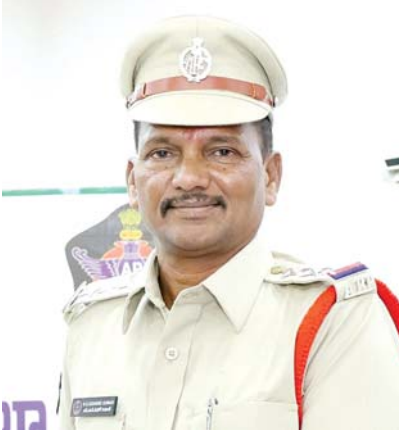
సేవిస్తే కేసు నమోదు చేస్తామని చెప్పారు. ప్రత్యేక బిట్లు ద్వారా ఇప్పటికే గస్తీలు నిర్వహిస్తున్నామన్నారు.

నియంత్రించే క్రమంలో జిల్లా ఎస్పీ కృష్ణ కాంత్ ఆదేశాల మేరకు నగర డివిజన్ శ్రీనివాసులు రెడ్డి పర్యవేక్షణలో ఇప్పటికే చంద్రబాబునగర్, కొత్తూరు ప్రాంతాల్లో ఇంటింటి క్షుణ్ణంగా తనిఖీ చేయడం జరిగిందన్నారు. అనుమానస్పదంగా ఉన్న వ్యక్తులను విచారించడంతోపాటు వాహనాల పత్రాలు లేని బైక్లను ఆటోలను స్వాధీనం చేసుకోమని అన్నారు. మిగతా ప్రాంతాల్లో కూడా కార్డెన్ సెర్చ్ కార్యక్రమాన్ని నిర్వహిస్తున్నట్లు చెప్పారు. బెట్టింగ్, పేకాట, వ్యభిచారం లాంటి అసాంఘిక కార్యకలాపాలకు పాల్పడితే కఠిన చర్యలు తీసుకుంటామని సీఐ హెచ్చరించారు. రోడ్లపై, ఓపెన్ స్థలాల్లో మద్యం