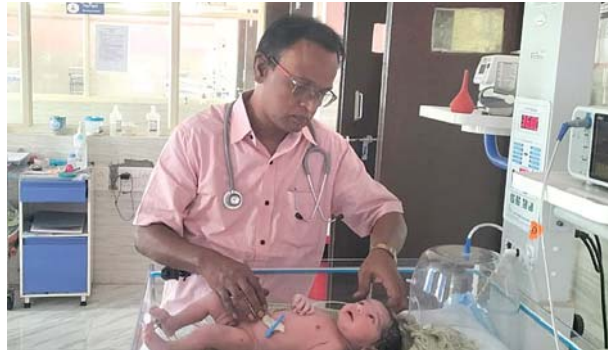
ఉందన్నారు. ల్యాబ్ సౌకర్యంతోపాటు కంటివిభాగం, స్టాఫ్ నర్సులు కూడా ఉన్నారని, అవసరమైన వారు ఈ బాలభవితకేంద్రాన్ని సందర్శించుకోవాలని వారు కోరారు.

ఆత్మకూరు, మేజర్స్ న్యూస్ : ఆత్మకూరులోని జిల్లాప్రభుత్వ వైద్యశాల ప్రాంగణంలో ఉన్న బాలభవితకేంద్రంలో పుట్టుకతో ఏదేని లోపాలున్నవారికి వైద్యసేవలందిస్తున్నామని ఈకేంద్ర వైద్యాధికారి తెలిపారు. కొందరికి వంకరపాదాలు, గ్రహణమురి, తదితర 12లోపాలుంటాయన్నారు. అలాంటి వారికి ప్రభుత్వబాలభవిత కేంద్రంలో వైద్యసేవలు లభిస్తాయన్నారు. పురిటిబిడ్డలనుండి 18నెలవరకు పువారికిఉచితంగా వైద్యం అందిస్తామన్నారు. న్యూరల్ట్యూబ్ డిఫెక్ట్లు, డౌన్సిండ్రోమ్, గ్రహణమురి, వంకరపాదాలు, పుట్టుకతోనే వినికిడిలోపం, సంక్రమిత కంటిపొర, గుండెనబంధిత వ్యాధులు, నాడీమండల సమస్యలు, జ్ఞానపరంగా అభివృద్ధిలో ఆలస్యం, మాటలు సరిగా రాకపోవడం తదితర సమస్యలకు చికిత్స అందిస్తామన్నారు. ఈ కేంద్రంలో చిన్నపిల్లల వైద్యులు, వైద్యాధికారి, డెంటల్ వైద్యులు, సామాజిక కార్యకర్తతోపాటు మానసికంగా అభివృద్ధిలోని పిల్లలకు విడతలవారిగా సైకాలజిస్ట్ కౌన్సిలింగ్ చేస్తారన్నారు. శారీరక ఎదుగుదల లోపాలున్నవారికి ఫిజియోథెరపీ సౌకర్యం కూడా