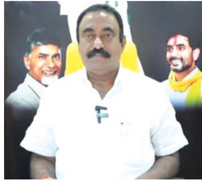
దానికి సిద్ధంగా ఉన్నాను అని తెలిపారు.

ప్రతిష్టాత్మకంగా తీసుకొని జరిగించాలని భక్తులకు తెలిపారు. వినాయక చవితి ఎమ్మెల్యే చేయమన్నారని అంటూ ఎవరైనా మీ ముందుకు చందాలకు వస్తే నాకు ఫిర్యాదు చేయాలని తెలిపారు. కావలి ప్రశాంతంగా ఉండాలని విజ్ఞాన లేకుండా ఉండాలని ఏ ఒక్కరూ కూడా చందాదారులను నేను ప్రోత్సహించని ఈ సందర్భంగా తెలిపారు. ప్రజల కష్టాలు తీర్చడానికి ఎల్లప్పుడూ సిద్ధంగా ఉంటానని ప్రజలకు ఎల్లప్పుడూ తోడుగా ఉంటానని వారు తెలిపారు. నా పేరు చెప్పి చందాలు దండే వారు ఎంతటి వారైనా సరే వారిపై చర్యలు తీసుకోవ