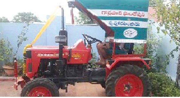
గార్లపాటి గ్రామపంచాయతీ పారిశుధ్య మెరుగుదల కార్యక్రమం