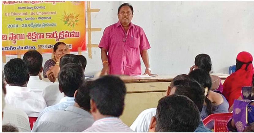
యువతీ, యువకులు తమ వయసు లను బట్టి ఈ అవకాశాన్ని వారు సద్వినియోగం చేసు 10వ తరగతి, ఇంటర్ పరీక్షలు రాయవచ్చని, కొనేలా చర్యలు చేపట్టాలని వారు కోరారు.