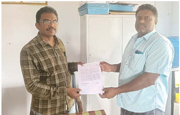
సంగం, మేజర్స్ న్యూస్ : సంగం మండలంలోని దువ్వూరు గ్రామంలో