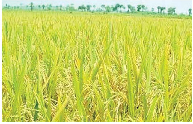
తోటపల్లి గూడూరు, మేజర్స్ న్యూస్ : గత నాలుగు రోజులుగా వాతావరణ