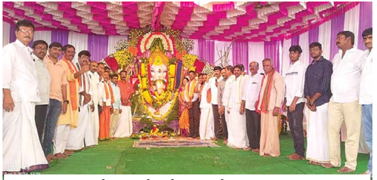
ఆత్మకూరులోని జెఆర్.పేటలో ఏర్పాటుచేసిన వినాయకవిగ్రహం