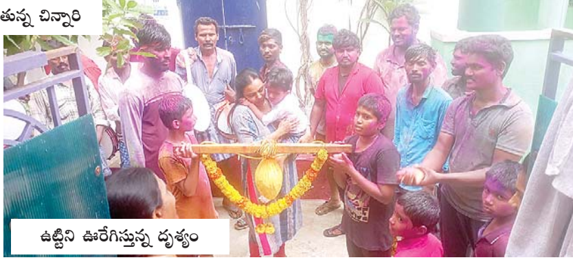
ఉట్టిని ఊరేగిస్తున్న పుత్రం

ఆత్మకూరు, మేజర్స్ న్యూస్ : ఆత్మకూరు పట్టణంలో ఆదివారం వినాయకచవితి ఉత్సవాల్లో భాగంగా రెండవరోజు ఉట్టిమహోత్సవాన్ని ఘనంగా నిర్వహించారు. పట్టణంలోని అన్ని ప్రాంతాల్లో దాదాపు 40 వినాయక విగ్రహాలను శనివారం ఏర్పాటుచేసి తొలిరోజు ప్రత్యేకపూజలు, అన్నదాన కార్యక్రమాలు నిర్వహించారు. రెండవరోజు అన్ని విగ్రహాలవద్ద ఉట్టిని ఆయా ప్రాంతాల్లో ఉత్సవం నిర్వహించిన అనంతరం విగ్రహాల వద్ద ఉట్టిని వ్రేలాడదీసి ఉట్టి కొట్టే కార్యక్రమాన్ని