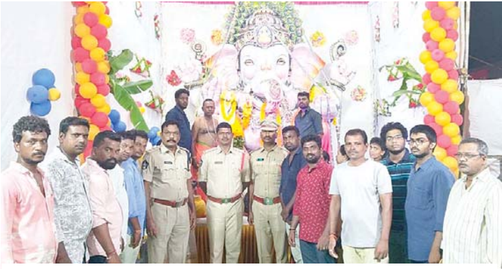
విగ్రహం వద్దపూజల్లో పాల్గొన్న డీఎస్పీ, సీఐ, ఎస్ఐ తదితరులు

ఆత్మకూరు, మేజర్స్ న్యూస్ : హిందువులందరికీ, తెలుగువారందరికీ అత్యంత ప్రీతిపాత్రమైన, ప్రాధాన్యతకలిగిన వినాయకచవితి పర్వదిన ఉత్సవాలకు శనివారం గ్రామగ్రామాన, వాడవాడలా శ్రీకారం చుట్టారు. ఎక్కడపడితే అక్కడ వినాయక విగ్రహాలను ప్రతిష్ఠించి పురోహితుల వేదమంత్రాలతో ఉత్సవాలను ప్రారంభించారు. అందరూ విగ్రహాలను శుక్రవారం సాయంత్రానికే హవానాల్లో తమ ప్రాంతాలకు తరలించారు. ప్రతిఏటా వినాయకచవితి ఉత్సవాలను అత్యంత ఘనంగా కోలాహలంగా జరుపుకోవడం తెలిసింది. ఈరోజు కూడా రెట్టింపు ఉత్సాహంతో ఉత్సవాలకు శ్రీకారం చుట్టారు. పోలీసులనుండి అనుమతులు పొందిన ప్రకారం ఆత్మకూరు పట్టణంలో దాదాపు