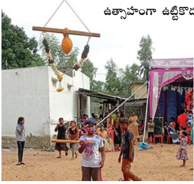
ఉత్సాహంగా ఉట్టికోడుతున్న చిన్నారు