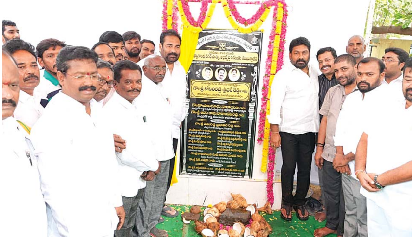
(మొదటి పేజీ తరువాయి) ప్రాంతాల్లో మరిన్ని పార్కులు అభివృద్ధి చేస్తామని, ప్రజలకు కావాల్సిన అన్ని వసతులతో పార్కులు