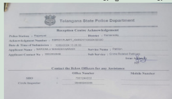
నిందితుడిపై కేసు నమోదు చేసిన యఫ్ఐఆర్..