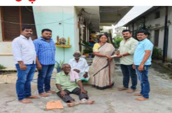
కామారెడ్డి జిల్లా ప్రతినిధి