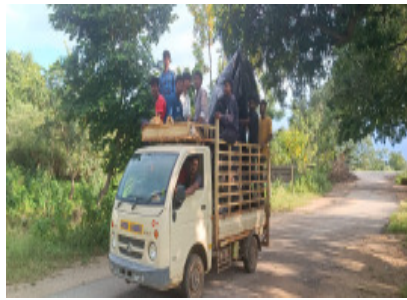
గణనాథుడును తరలిస్తున్న దృశ్యం..

నాగిరెడ్డిపేట్, సెప్టెంబర్ 06, సూర్య మేజర్ న్యూస్: పార్వతీ పారమేశ్వరుల ప్రాణ పుత్రుడు. గణనాథుడు నేడు కొలువుదీరనున్నాడు. ఉండ్రలయ్యాకు దండాలు పె దుతూ నిత్య పూజలు అందించేందుకు భక్తులు సమాయత్తమయ్యారు. విఘ్నాలు తొలగించు వినాయక.. అంటూ మండపాల్లో వెలసిన దేవదేవుడికి విన్నవించే రోజు ప్రారంభం కానున్నది. ఏ కార్యం తలపెట్టినా ఆది పూజలు అందేది వినాయకుడికే. ఏ ప్రతం చేపట్టినా గణపతి స్తోత్రంతోనే పూజలు ప్రారంభించడం అనవాయితీ. మండపాల్లో కొలువుదీరనున్న వినాయకుడు మండలంలోని అన్ని గ్రామాలలో మండపాలను ఏర్పాటు చేసుకున్న నిర్వాహకులు విగ్రహాలను సిద్ధం చేసుకున్నారు. మరికొందరు మండపాల నిర్వాహకులు విగ్రహాలను కొనుగోలు చేసి వాహనాల్లో విగ్రహాలను తీసుకెళన్నారు. పండుగ వేళ పూజ సామగ్రి కోసం ప్రజలు రోడ్లపైకి రావడంతో మార్కెట్లు కిటికిటలాడుతున్నాయి.