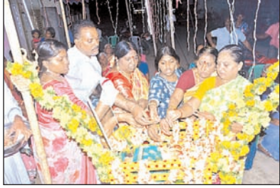
మహిళలు విరివిగా పాల్గొన్నారు.