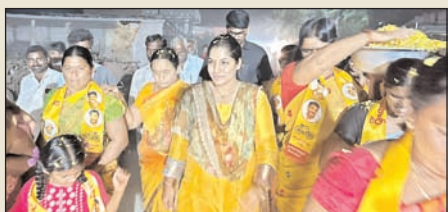
చంద్రబాబు సేవలు మరువలేనివి 8లో...