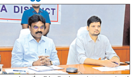
బాపట్ల, మేజర్నూస్: స్వర్ణాంధ్ర-2047 లక్ష్యంతో అధికారులు ప్రణాళికలు రూపొందించి చిత్తశుద్ధితో పని