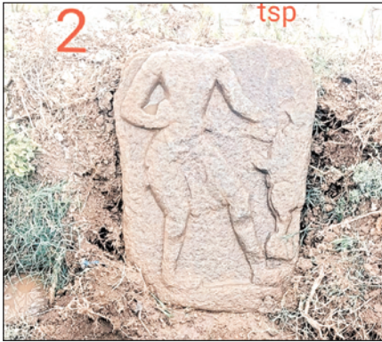
కొప్పుతో ఉన్న వీరుని చేతిలో పదునైన బరిసె శత్రువులు లేదా జంతువులపైకి ఎక్కువెట్టినట్లుగా ఉన్నది. ఇది పురుష 'వీరగల్లు'. నడుముకు