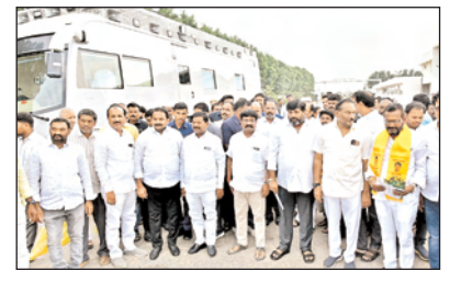
పాటు వివిధ శాఖలు సమన్వయంతో పనిచేసి ఏర్పాట్లు చేయడంతో ముఖ్యమంత్రి పర్యటన విజయవంతంగా ముగిసింది.