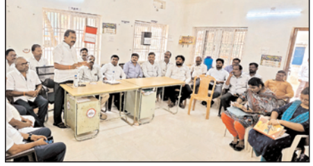
నిర్వహించారు. ఈ సందర్భంగా కోటపాటి జనార్దన్ రావు మాట్లాడుతూ ప్రతి సచివాలయం సిబ్బంది కూటమి నాయకులు సమన్వయంతో ప్రతి ఇంటింటికి వెళ్లి

పామూరు, మేజర్ న్యూస్: రాష్ట్రంలో అధికారం చేపట్టిన 100 రోజుల పాలనలో అనేక సంస్కరణలు, విపత్తులను ఎదుర్కోవడంలో ముఖ్యమంత్రి నారా చంద్రబాబు నాయుడుకు అపార అనుభవం తోడ్పడిందని టిడిపి రాష్ట్ర కార్యదర్శి కోటపాటి జనార్దన్ రావు అన్నారు. ఇది మంచి ప్రభుత్వం వందరోజుల పండుగ కార్యక్రమాన్ని ఇంటింటికి వెళ్లి ప్రభుత్వం చేపట్టిన సంక్షేమ పథకాలను వివరిస్తూ కరపత్రాలను అందజేసి ఇంటింటికి స్వికార్లను అంతకించాలని శనివారం పట్టణంలోని మేజర్ పంచాయతీ కార్యాలయంలో పంచాయతీ అధికారులు నాయకులతో సమావేశం