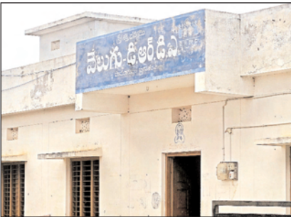
వాడటం పట్ల ప్రజానీకం విస్తుపోతున్నారు. జిల్లా డుమా డిఆర్డిఎ క్రాంతి పథకం సర్వవేక్షిస్తున్న అధికార యంత్రాంగం చర్యలు తీసుకొని పామూరు

పామూరు, మేజర్ న్యూస్ : టిడిపి కూటమి ప్రభుత్వం అధికారంలోకి వచ్చి 100 రోజులు దాటిన వెలుగు కార్యాలయంలో వైయస్సార్ కెపి ఏడిఆర్డిఎ పేరుతోనే స్టాంపు తంబు ఇంకా వాడుతున్నారంటే వెలుగు కార్యాలయం పనితీరు ఏ విధంగా ఉందో అర్థమవుతుంది. రాష్ట్రంలో ఇది మంచి ప్రభుత్వం అధికారంలోకి వచ్చి 100 రోజులు చేసిన అభివృద్ధి సంక్షేమ కార్యక్రమాలపై ఉత్సవాలు జరుగుతుంటే క్షేత్రస్థాయిలో వెలుగు కార్యాలయంలో పని తీరు మాత్రం మారలేదు. గత ప్రభుత్వంలో వైయస్సార్ కెపి పదం పేరుతో నడిచింది. కూటమి ప్రభుత్వం అధికారంలో ఉన్న కూడా అదే పేరుతో ఉన్న స్టాంపు ముద్రను