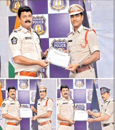
నిర్వహించాలని, సిబ్బంది ప్రవర్తన సరిగా లేకుంటే వారిపై శాఖాపరమైన చర్యలు తీసుకోవటం జరుగుతుందని, పోలీస్ శాఖపై నమ్మకం