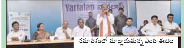
సమావేశంలో మాట్లాడుతున్న ఎంపీ ఈటల