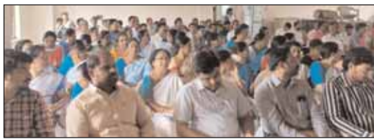
రంగారెడ్డి జిల్లా ప్రతినిధి, మేజర్ న్యూస్ (సెప్టెంబర్ 04): మిగతా 2లో