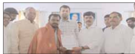
రైతులకు చెక్కులు, ఇళ్ల స్థలాల పట్టాలు అందిస్తున్న దృశ్యం

మాట్లాడుతున్న జిల్లా కలెక్టర్ ప్రతీక్ జైన్ కొడంగల్, మేజర్ న్యూస్ (సెప్టెంబరు 4): అభివృద్ధి పనులకు భూములు ఇవ్వడం హర్షణీయమని వికారాబాద్ జిల్లా కలెక్టర్ ప్రతీక్ జైన్ అన్నారు. సీఎం రేవంత్ రెడ్డి సొంత నియోజకవర్గం కొడంగల్ మండలంలోని అప్పాయిపల్లి గ్రామ శివారులోని సర్వే నెం.19లో చేపట్టనున్న మెడికల్, వైద్య కళాశాలల ఏర్పాటుకు మిగతా 3లో