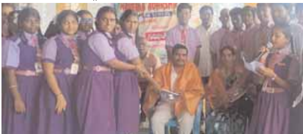
నవీన ఆదర్శ పాఠశాలలో ఉపాధ్యాయులను సన్మానిస్తున్న విద్యార్థులు