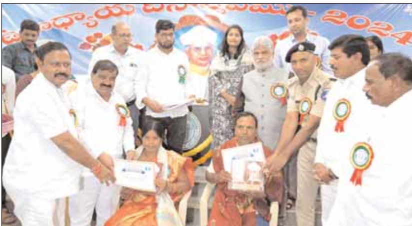
ఉత్తమ ఉపాధ్యాయులను సన్మానిస్తున్న దృశ్యం.