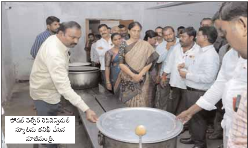
సోషల్ వెల్ఫేర్ రెసిడెన్షియల్ స్కూల్ ను తనిఖీ చేసిన మాజీమంత్రి.

బాలాపూర్ మేజర్ న్యూస్ (సెప్టెంబర్ 05): నాదర్నల్ లో ఉన్న సోషల్ వెల్ఫేర్ రెసిడెన్షియల్ స్కూల్ ను స్థానిక ఎమ్మెల్యే సబితా ఇంద్రారెడ్డి అకస్మాత్తుగా తనిఖీ చేశారు. మహేశ్వరం నియోజకవర్గ పరిధిలోని బడంగ్గోట్ మున్సిపల్ కార్పొరేషన్ నాదర్నల్ గ్రామంలో గల సోషల్ వెల్ఫేర్ రెసిడెన్షియల్ ఉన్నత పాఠశాలను రాష్ట్ర మాజీ విద్యాశాఖ మంత్రి మహేశ్వరం శాసనసభ్యురాలు సబితా ఇంద్రారెడ్డి గురువారం అకస్మాత్తుగా తనిఖీ చేసి విద్యార్థులతో మాట మంది నిర్వహించి వారి సమస్యలు అడిగి తెలుసుకున్నారు. రాష్ట్ర శాసన సభ్యురాలు సబితా ఇంద్రారెడ్డి మాట్లాడుతూ... ప్రస్తుత రాష్ట్ర ప్రభుత్వం విద్యా వ్యవస్థను బ్రష్టు పట్టిందని సాంఘిక సంక్షేమ గురుకుల పాఠశాలను పట్టించుకున్న పాపాన పోవట్లదని అన్నారు. రెసిడెన్షియల్ లో చదువుకున్న విద్యార్థులు ఎన్నో అవస్థలు పడుతూ మరీ విద్యా వ్యవస్థను ముందుకు కొనసాగించ లేకపోతున్నారని తెలిపారు. తాగడానికి మంచినీరు నాణ్యమైన ఆహారం అందించ లేక పేద విద్యార్థుల భవిష్యత్తుతో రాష్ట్ర ప్రభుత్వం ఆటల ఆడుకుంటుందని ఆమె ఆవేదన వ్యక్తం చేశారు. తక్షణమే ముఖ్యమంత్రి స్పందించి ప్రభుత్వ