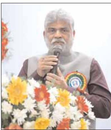
మాట్లాడుతున్న స్పీకర్ ప్రసాద్ కుమార్.

వికారాబాద్ జిల్లా ప్రతినిధి, మేజర్ న్యూస్ (సెప్టెంబర్ 05): మహనీయులను స్ఫూర్తిగా తీసుకొని విద్యా బోధన చేయాలని శాసనసభ సభాపతి గడ్డం ప్రసాద్ కుమార్ ఉపాధ్యాయులకు సూచించారు. గురువారం