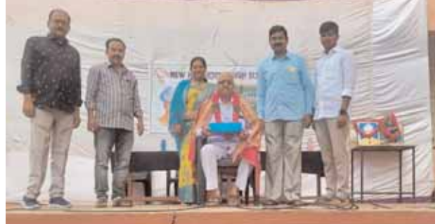
ఉపాధ్యాయులు, విద్యార్థులు పాల్గొన్నారు.