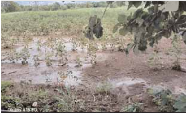
నీట మునిగిన పత్తి పంట

మర్నాటి మేజర్ న్యూస్ (సెప్టెంబర్ 05) గత వారం రోజులుగా ఎడతెలరపి లేకుండా కురిసిన వర్షాలకు పంటలు నీట మునిగి రైతులు తీవ్రనష్టాలను చవిచూశారు