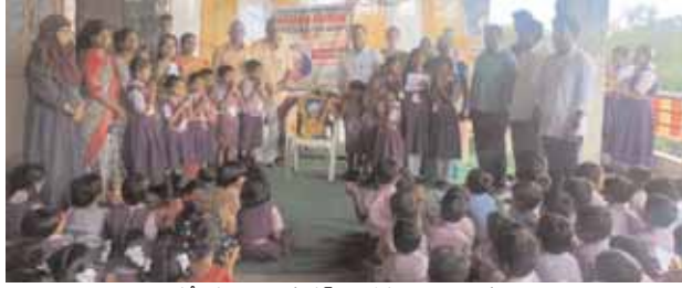
సర్వేపల్లి రాధాకృష్ణన్ చిత్రపటానికి నివాళులు అర్పిస్తున్న ఉపాధ్యాయులు, విద్యార్థులు